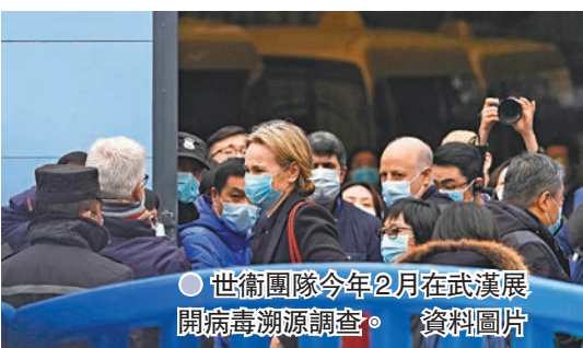
●世衛團隊今年2月在武漢展開病毒溯源調查。 資料圖片