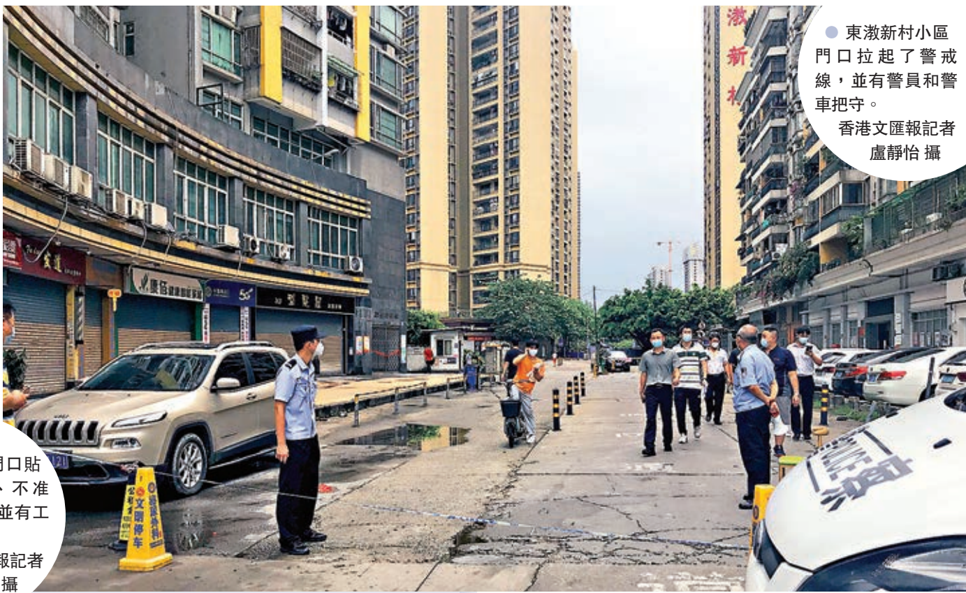
東濠新村小區門口拉起了警戒線,並有警員和警車把守。

目前,華福御水岸小區風險等級由低風險調整為中風險,實行封閉管理,該管理區域的1間學校和3家幼兒園已全部停課。