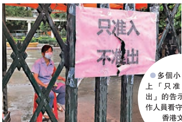
多個小區門口貼上「只准入、不准出」的告示,並有工作人員看守。

出,5月21日到目前,廣州市荔灣、海珠兩區共報告了5例確診病例和9例無症狀感染者,這提示病毒傳播速度快、傳染能力強。