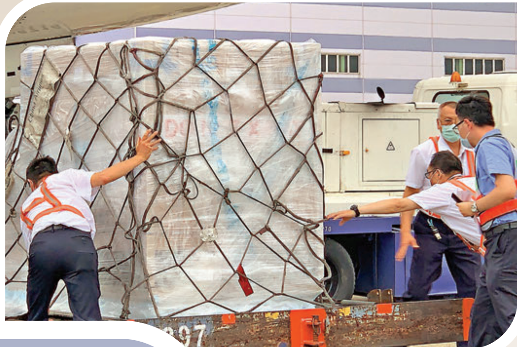
●台灣向莫德納 (Moderna) 藥廠採購 505 萬劑新冠疫苗，首批 15 萬劑 28 日運抵。

台灣本土新冠肺炎病例突破六千宗，一線醫療人員承受巨大壓力，民眾沒有足夠的疫苗注射，日常生計也受到嚴重影響。面對質疑聲浪，台灣地區領導人蔡英文非但沒有反思和歉意，還連續幾日在社交媒體fb上，炫耀當局「採購了世界上最好的疫苗」，聲稱自己對於防疫事務、對外關係、採購疫苗等是「親自督軍」。不過台灣民眾對此並不買賬，香港文匯報梳理蔡英文fb下的評論，台灣民眾對於當局缺乏超前部署特別是疫苗採購不到位，以及缺乏疫下民生支持，顯示極度不滿。