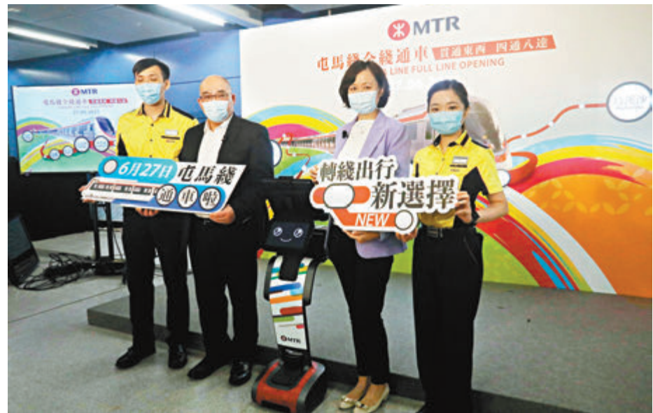
●不少市民期待的屯馬綫將於下月27日全綫通車。 香港文匯報記者攝