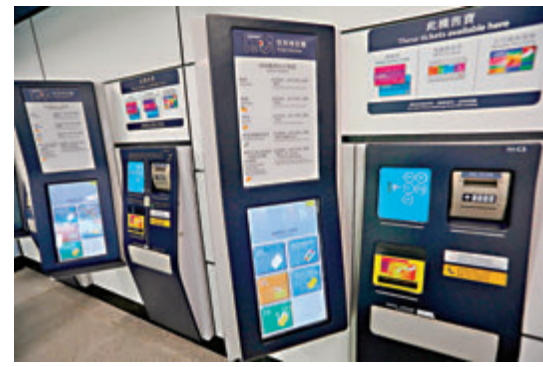
●乘客可使用售票增值機購買單程票等。

屯馬綫打通新界東西及九龍區，與部分小巴綫重疊，九巴預計將有40條巴士路線受影響，其中兩條有機會即將取消。陳帆表示，在新鐵路營運後，整體的公共交通需求以至流量都會有所轉變，運輸署會密切留意路面交通以至鐵路的運作，會適時作出調整，以確保市民的出行需要受到照顧，並保持香港公共交通的運作有效和可負擔，讓有關的營辦商可以有生存的空間。