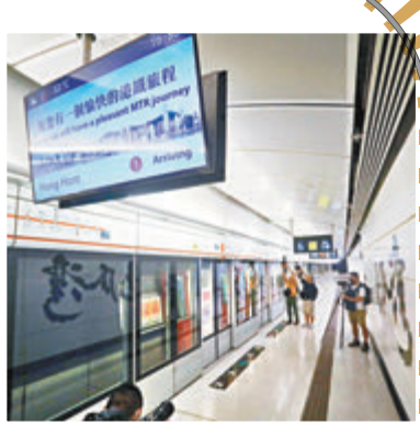
●列車即將到達，港鐵祝乘客有一個愉快的港鐵旅程。