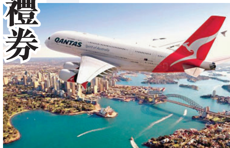
●澳航表明一旦重啟國際航班，將要求乘客接種疫苗。