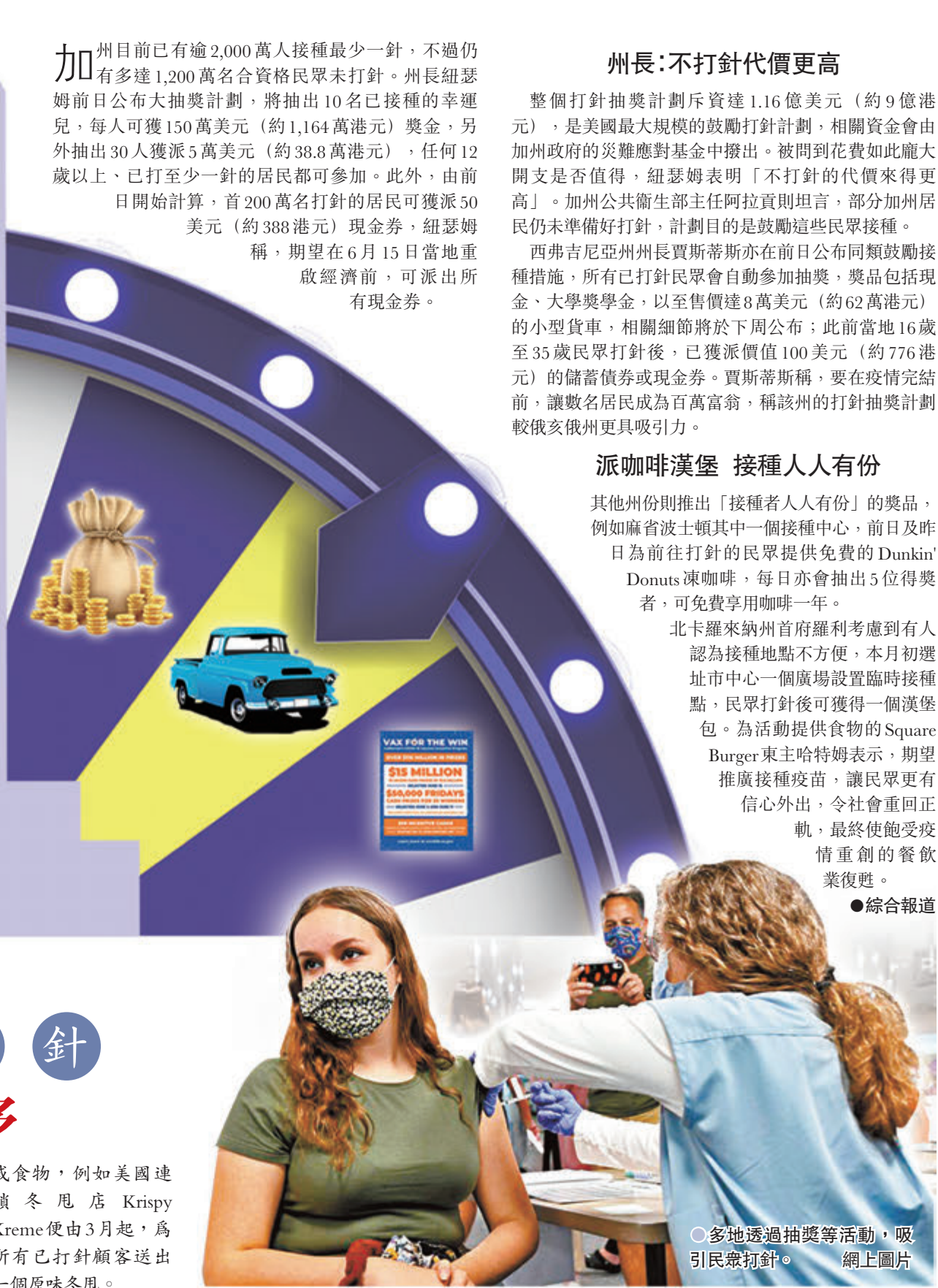
●多地透過抽獎等活動，吸引民眾打針。