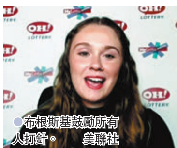
●布根斯基鼓勵所有人打針。