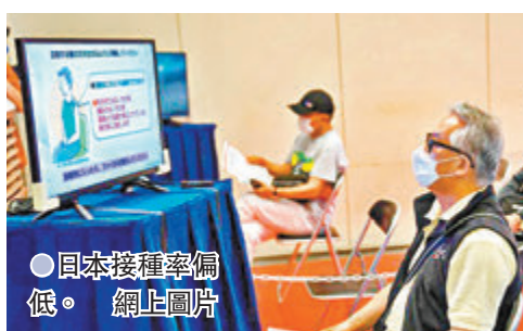
●日本接種率偏低。