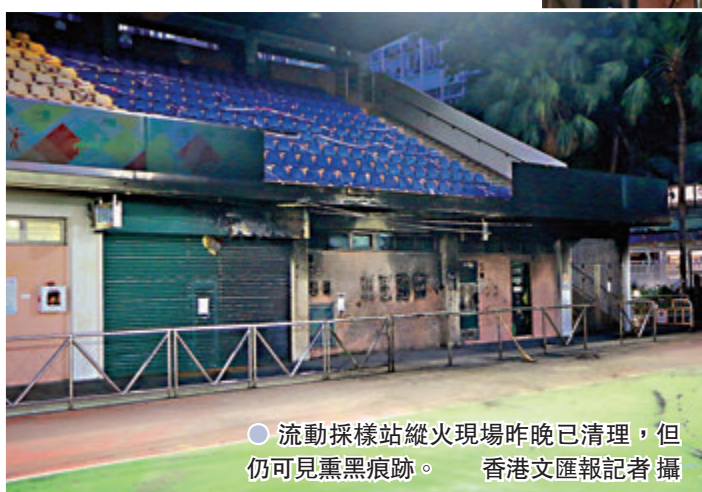
●流動採樣站縱火現場昨晚已清理,但仍可見熏黑痕跡。

立法會新界西議員、民建聯陳恒鑽昨日接受香港文匯報訪問時強烈譴責向流動採樣站縱火的暴行。他指出,設立流動採樣站是為了方便市民做檢測,屬防疫抗疫的措施,批評縱火者作出如此喪心病狂的行為,罔顧社會福祉及市民的利益。由於沙咀道遊樂場的流動