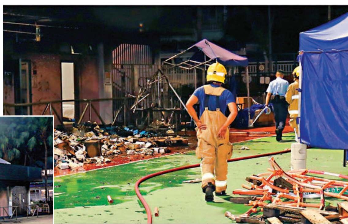
●消防員將火救熄後,經調查認為火警有可疑。警方列作縱火案處理。

根據香港法例,一般的刑事毀壞如打碎商場內玻璃等,最高刑罰可以判處監禁10年;縱火屬嚴重的刑事毀壞,因為可以牽連甚廣或導致人命傷亡,根據香港法例《刑事罪行條例》第六十條,縱火罪可依例判終身監禁。