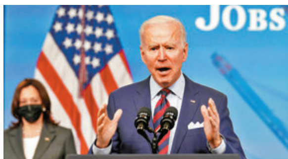
●拜登據報會於今日提交財政預算案。資料圖片

預算案將提出到2031年，將聯邦政府每年開支增至8.2萬億美元(約63.6萬億港元)，原因是要執行拜登早前提出的「美國就業計劃」和「美國家庭計劃」兩項方案，大幅增加基建及社會福利開支。為了開源，預算案將提出提高高收入人士及企業稅率，目標在未來15年內抵消基建計劃等增加的開支。