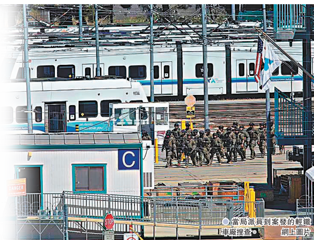
●當局派員到案發的輕鐵車廠搜查。