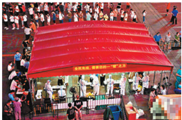
● 廣州出現新增本土確診病例後，自26日下午到27日下午，荔灣區不斷開展核酸篩查。

由於打疫苗的市民過多，廣州多個區已經取消現場派號，改為全部線上預約。但預約的市民過多，包括「廣州健康通」在內的多個預約平台昨日無法登錄，截至昨晚8時仍未恢復。對於市民的關切，廣州市衛健委強調，當前廣州疫苗供應基本穩定。