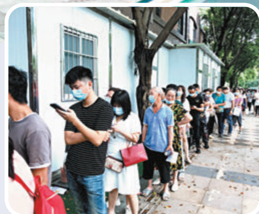
● 廣州荔灣區花地街道社區衛生中心外，等候打疫苗的人排起了近1公里的隊伍。