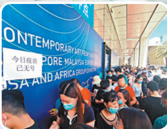
● 深圳福田區文山社康新冠疫苗臨時接種點外，儘管已打出「今日疫苗已無號」告示，市民仍排隊等待。