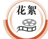
● 香港文匯報記者郭若溪 深圳報道

在志願者的指引下，汪女士完成了疫苗第一劑注射，「疫苗接種點安排都很科學，工作人員解釋到位，秩序也非常好。我會鼓勵家人、朋友盡快接種，大家齊心建立起一道群體免疫屏障。」