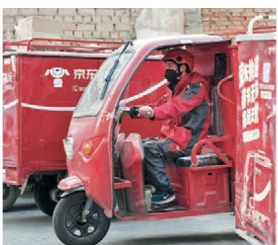
●市場消息指，京東物流一手中籤率只有8%，認購300手方可穩獲一手。

市場消息指，京東物流獲逾137萬人追捧，一手中籤率只有8%，認購300手(30,000股)方可穩獲一手。消息續指，京東物流公開發售部分，錄得超購715倍，凍資5,731億元。該股若成功掛牌上市，將成為繼京東(9618)及京東健康(6618)後，京東系內第三隻港股，而且它們上市時間距離不足一年。京東物流聯席保薦人為美林、高盛及海通國際。