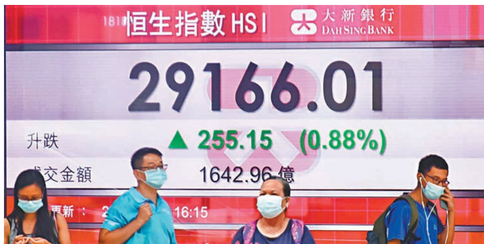
●恒生指數昨日漲幅0.88%，主板上全成交1,642.96億元。

香港文匯報訊(記者 周紹基) 美匯指數續向下走，人民幣兌美元中間價更升至6.4，吸引資金繼續流入A股及港股，恒指昨日升255點，收報29,166點，成交1,642億元。市場分析指，今波美元下跌，適逢虛擬貨幣崩盤，商品價格升幅也見疲勞，令外資選擇停泊到人民幣及中資股等資產，若市場資金繼續增加，相信港股及A股都可受惠。