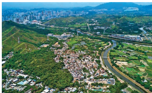
●港鐵古洞站及北環綫鐵路工程預算投放達620億元。資料圖片

歐陽伯權在股東會表示，疫情對經濟仍有挑戰，料公司業務今年仍受影響，而本港零售短期內預計依然低迷，相信港鐵租金收入仍受影響，但對短中長期的發展仍感樂觀。港鐵宣布，未來10年會投資大約1,000億元推展各項新鐵路項目，當中以古洞站及北環綫投資最大，金額達到620億元。其餘屯門南延綫及東涌綫延綫分別預計造價為114億元及187億元。