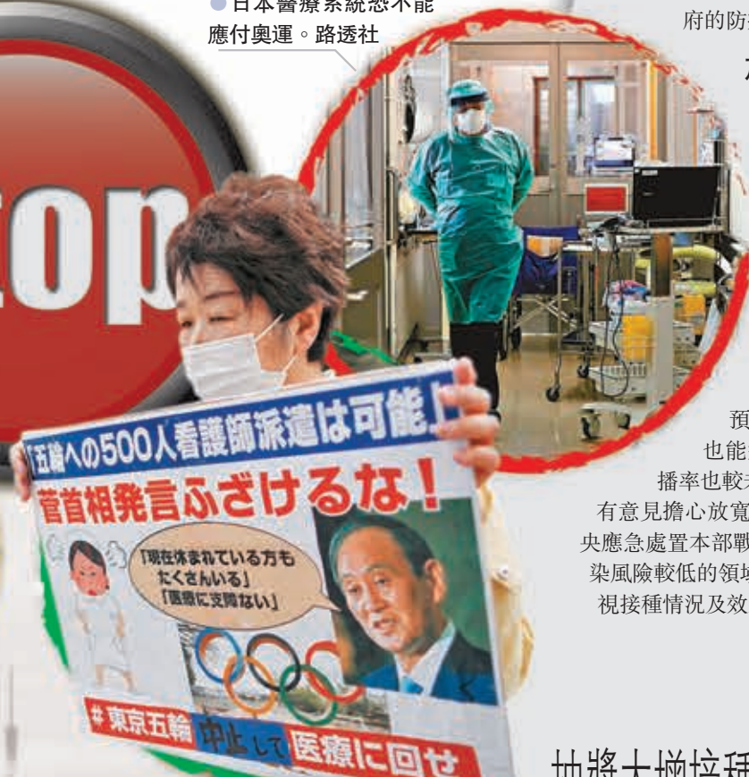
●日本社會反對舉辦東奧情緒日漸加深。