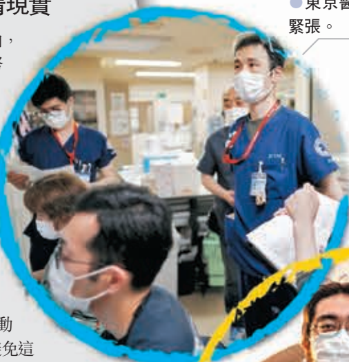
●東京醫療系統緊張。