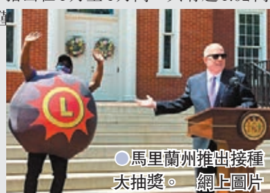
●馬里蘭州推出接種大抽獎。網上圖片