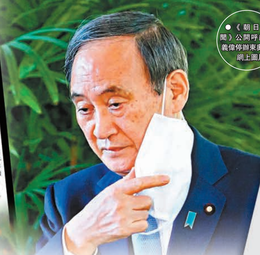
●《朝日新聞》公開呼籲菅義偉停辦東奧。網上圖片