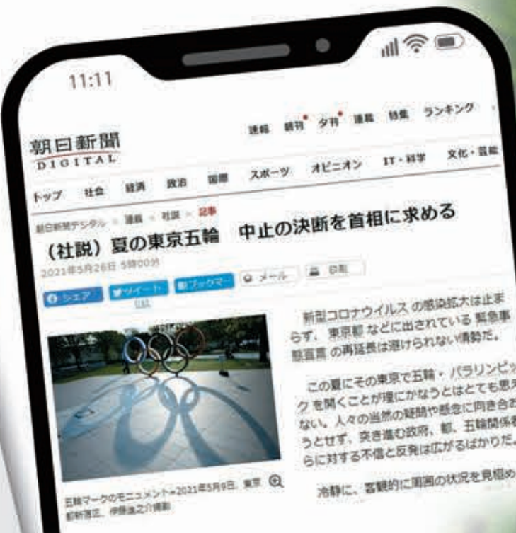
●《朝日新聞》社論引起極大迴響。網上圖片