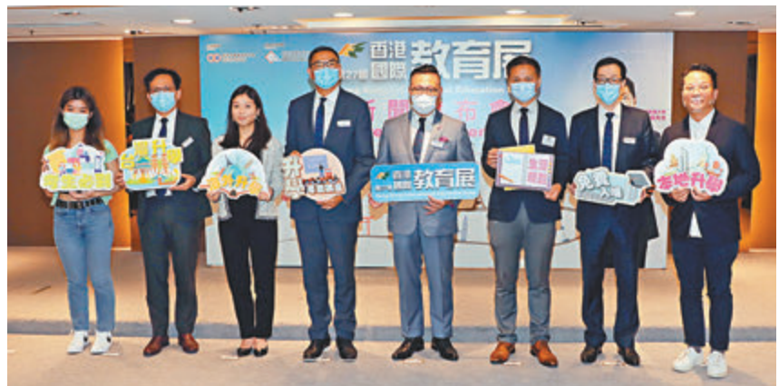
●廠商會將於本周六起一連兩天舉辦「第二十七屆香港國際教育展」。

他相信，考生於準備文憑試的過程中，已對自己的興趣和擅長科目再進行評估，建議學生可根據個人興趣、能力及就業計劃等多方面作考慮，同時需要留意就讀院校課程的認可性。