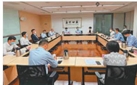
●楊潤雄與深圳市教育局局長陳秋明會面，就兩地教育的最新發展及合作進行交流。

香港文匯報訊 香港特區政府教育局局長楊潤雄昨日到訪深圳，與當地官員交流教育發展合作事宜和粵港澳大灣區發展機遇，其後出席學校封頂儀式和大學合作意向書簽署儀式。 昨日上午，楊潤雄與深圳市教育局局長陳秋明會面，就兩地教育的最新發展及合作進行交流，共同把握粵港澳大灣區的發展機遇。討論事項涵蓋高等教育、職業專才教育及基礎教育。 楊潤雄表示，香港特區政府鼓勵及支持本港的辦學團體及專上院校積極融入粵港澳大灣區的發展，參與相關建設及提供教育服務，這既能為大灣區培育人才，亦能為本港的年輕人提供更廣闊的發展空間。 當日下午，楊潤雄為深圳香港培僑書院龍華信義學校的封頂儀式主禮，該校為一條龍中小學，預期今年9月開學。此外，他還出席深圳大學與嶺南大學的一項簽署儀式，見證兩校簽署合作意向書，內容包括共同開辦課程、共建高等研究院，以及探討建立大灣區聯合校區的可行性。