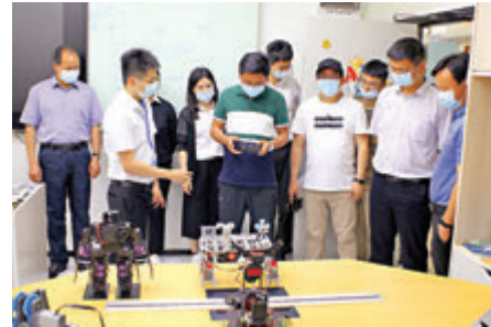
●交流團參觀了新華學校 Steam 室。