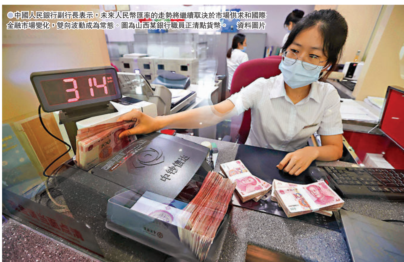
中國人民銀行副行長表示，未來人民幣匯率的走勢將繼續取決於市場供求和國際金融市場變化，雙向波動成為常態。圖為山西某銀行職員正清點貨幣。資料圖片

香港文匯報訊(記者 海巖 北京報道)在國際大宗商品價格過快上漲的背景下，市場近期對人民幣升值的呼聲升溫。繼金融委會議明確表示要保持人民幣匯率在合理均衡水平上的基本穩定後，中國人民銀行副行長劉國強昨日表示，未來人民幣匯率的走勢將繼續取決於市場供求和國際金融市場變化，雙向波動成為常態。劉國強強調，人民銀行將注重預期引導，發揮匯率調節宏觀經濟和國際收支自動穩定器作用，保持人民幣匯率在合理均衡水平上的基本穩定。