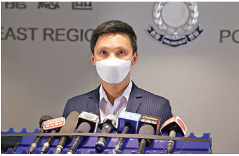
●莫子威總督察指，首次揭發「假冒官員」電騙中，騙徒要求事主以物業抵押借貸意圖「呢到盡」。