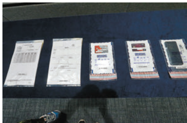
●警方在電騙記者會上展示檢獲的銀行卡及手提電話等證物。