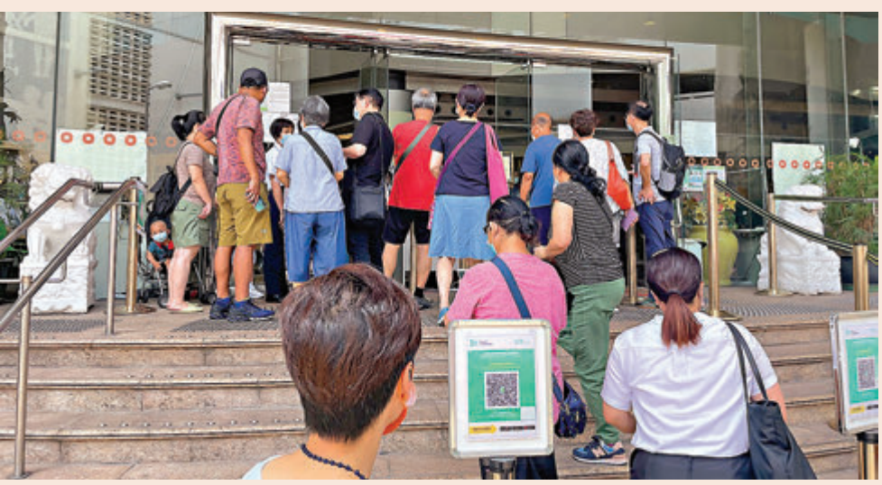
●樂富中心的申請表昨早11時已全數派完，不少市民因而「摸門釘」。

貴，畀界供得起嘅人買，我得幾萬到10萬元首期，買完樓仲要供，所以都係租置單位啱喇！」