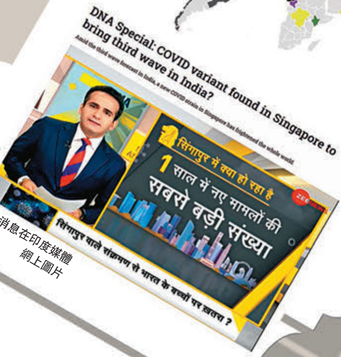
●假消息在印度媒體擴散。網上圖片