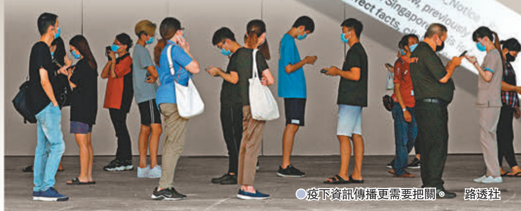
●疫下資訊傳播更需要把關。