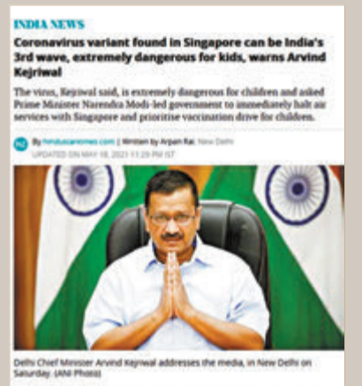
●印度部分媒體仍未下架報道。

新加坡衛生部重申，所謂的「新加坡變種毒株」並不存在，也沒有證據顯示任何變種毒株「對兒童非常有害」，當地最近數周有多宗確診患者都是感染源自印度的「B.1.617.2」毒株。發言人說，新加坡發現該毒株前，該毒株已經在印度出現並傳播。