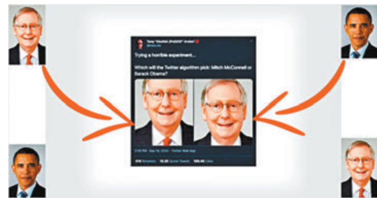
●有網民用奧巴馬與白人參議員的照片測試，發現演算法偏向白人。