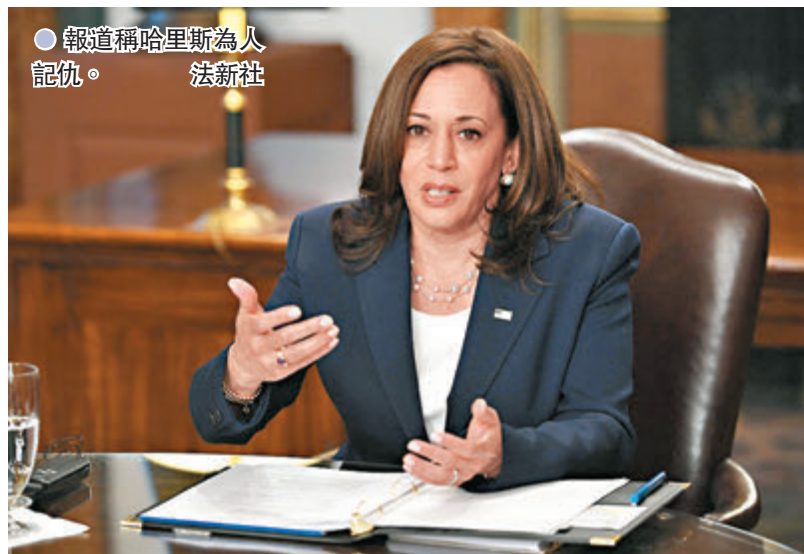
●報道稱哈里斯為人記仇。

美國副總統哈里斯帶着多個「歷來第一位」光環上台，但就職至今未見有太多突出政績，《大西洋》月刊日前就報道，哈里斯上任以來對傳媒一直表現冷淡，更會親自製作「黑名單」，記下不理解或不欣賞她人生經歷的記者和政治人物。