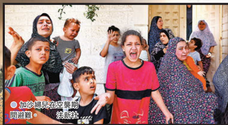
●加沙婦孺在空襲期間避難。