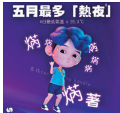
●天文台指今個月雖未完結，香港的熱夜數目已打破歷來5月最多熱夜的紀錄。

熱夜增加的趨勢同樣在全年熱夜紀錄中反映，去年是香港近140年有紀錄以來錄得最多熱夜的一年，共有50日，同時亦是香港有紀錄以來第二最熱的一年，全年平均氣溫為攝氏24.4度。