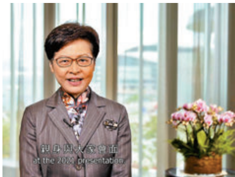
▲行政長官林鄭月娥為頒獎禮致賀辭。2020年度邵逸夫獎網上頒獎禮截圖

受新冠疫情影响，2020年度邵逸夫獎頒獎禮延至昨日舉行，並首次以網上直播形式，向6名傑出學者頒發天文學、生命科學與醫學、及數學科學三個獎項。行政長官林鄭月娥在頒狀禮上致賀辭表示，疫情進一步凸顯了科研創新的重要性，感謝各得主透過科學締造更美好世界。生命科學與醫學獎得獎人格羅·米森伯克則分享道，最有價值的研究往往是充滿變數且不可預測，甚至乍看起來「毫無用處」，寄語應以長遠目光看待研究，感謝邵逸夫獎持續嘉許基礎發現，肯定基礎研究的價值。