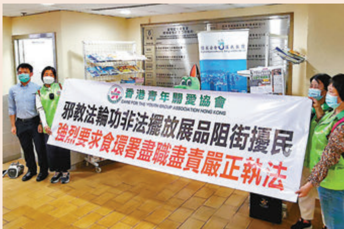
香港青年關愛協會要求食環署在法可依的情況下，徹底清除法輪功非法阻街的展示品。 香港文匯報訊 特區終審法院本月13日駁回法輪功在全港宣傳據點展示示威橫額及展板的終極上訴後，法輪功依舊違法擺放橫額及展板。 香港青年關愛協會昨日連同多個團體組織到旺角花園街市政大廈向食環署示威。 協會代表質疑，署方在法可依的情況下仍未採取相應行動執法，故強烈要求食環署立即果斷執法，盡快清除法輪功阻街擾民的展示品，回復社會及公眾秩序。 ●香港文匯報記者 倪思言