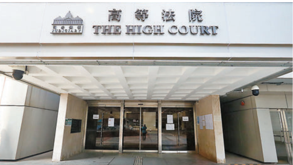
「803基金有限公司」要求教育局公開已被裁定專業操守失當的教師姓名、涉事學校名稱等資料被拒，其後入稟申請司法覆核要求推翻，案件昨日上午於高等法院審理。資料圖片

答辯方續說，局方及教師共同理解教師個人資料只會用作調查，不會公開予第三方，有別於刑事案件中即使教師身份也會公開處理。若局方輕易公開涉事教師身份及學校名稱，將會為對方造成巨大壓力，