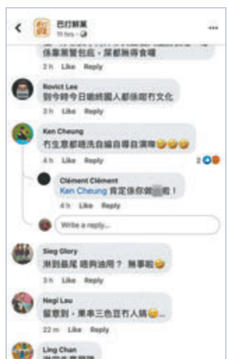
網民質疑「巴打鮮菓」因為無生意，要自編自導自演被淋紅油。