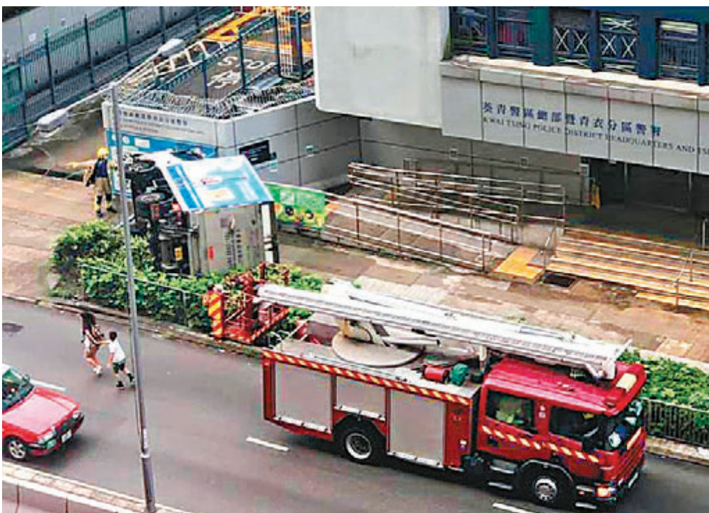
●一輛貨車在青衣鄉事會路失控剷上行人路,撞向警署外牆後翻側。

昨晨8時15分左右,黎駕駛密斗貨車沿青衣長環路右轉入青衣鄉事會路向楓樹崗路方向,但轉彎後貨車突然甩尾,直衝向路中安全島,眼見安全島有途人,司機即扭軚「救車」閃避,但貨車繼而向左橫衝向警署,越過花槽鏟上行人路,撞毀路牌、鐵柱,撞向警署外牆後翻側,橫亘在行人路,車頭擋風玻璃爆裂。其間,行人路上有數名途人,包括小童,見狀即時向兩邊爭相走避,幸未被殃及。