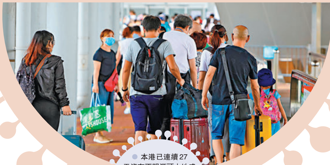
●本港已連續27 天沒有不明源頭本地感 染個案，令香港與內地及 澳門的通關之路漸現曙光。 圖為早前市民在深圳灣口 岸過關情況。