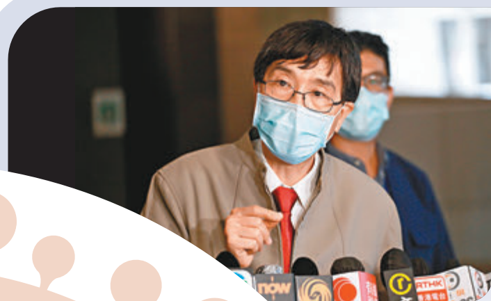
●袁國勇於公共衛生 檢測中心見記者。