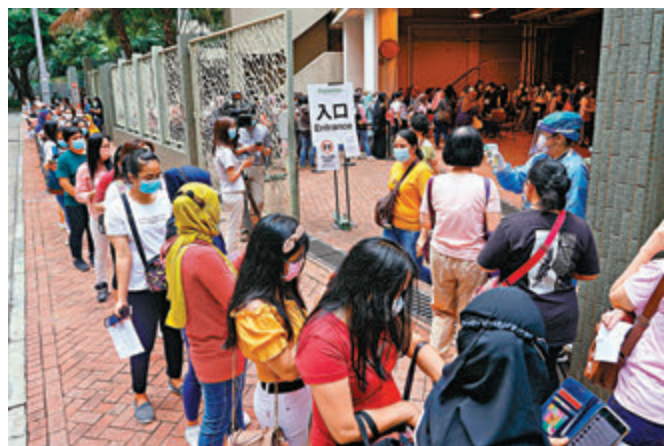
●外傭強制檢測，是本港外防輸入的舉措之一。 資料圖片

早前，一名曾在2月於意大利確診的男子，經香港返上海後也被驗出對病毒呈陽，但歐家榮相信他也是復陽個案。香港大學感染及傳染病中心總監何栢良建議衛生防護中心應向上海衛生部門了解他是經核酸抑或基因檢測確診，若是經核酸檢測確診就應同時索取基因排序，以追查個案會否與西營盤華美達酒店出現傳播有關。