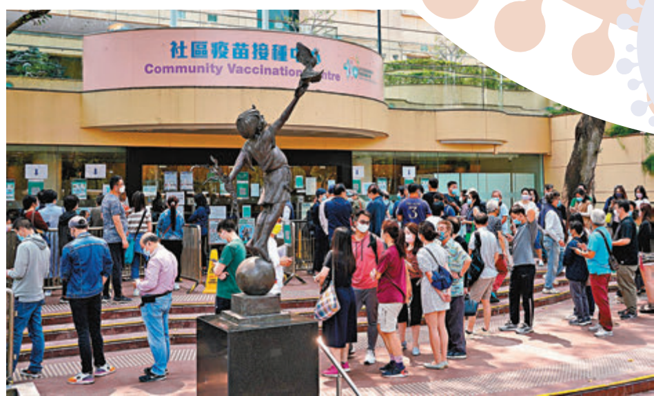
●專家指出，接種疫苗是防止疫情再爆發的惟一出路。圖為市民等候接種疫苗。 資料圖片