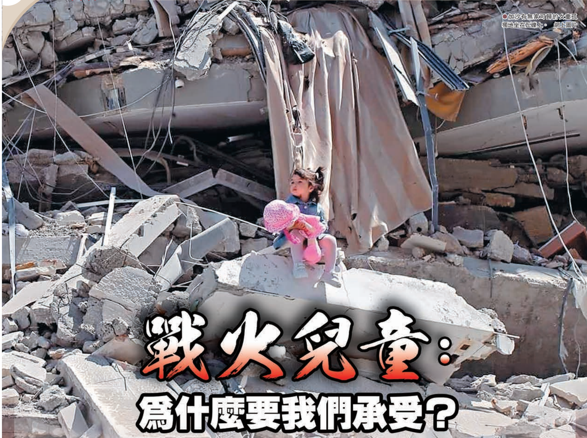
●加沙有無家可歸的女童孤獨地坐在瓦礫上。