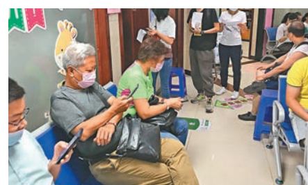
●一名白髮蒼蒼的老年人完成接種。

報記者，接種前，醫生已經為他評估了健康狀況，認為可以接種。為此，他到社區衛生中心預約，並於19日完成了首劑的接種。