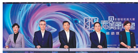
●19日，首屆「看見美麗中國」全國短視頻大賽在北京啟動。

香港文匯報訊 據央視新聞客戶端報道，5月19日，首屆「看見美麗中國」全國短視頻大賽在北京啟動。大賽經中宣部批准，由中央網信辦網絡傳播局、教育部思想政治工作司、共青團中央宣傳部、全國婦聯宣傳部共同指導，浙江省委宣傳部支持，中央廣播電視總台新聞新媒體中心、國家（杭州）短視頻基地、浙江省湖州市委、湖州市人民政府以及中國傳媒大學聯合主辦。中宣部副部長、中央廣播電視總台台長兼總編輯海雄，浙江省湖州市委書記馬曉暉等出席並共同啟動大賽活動。