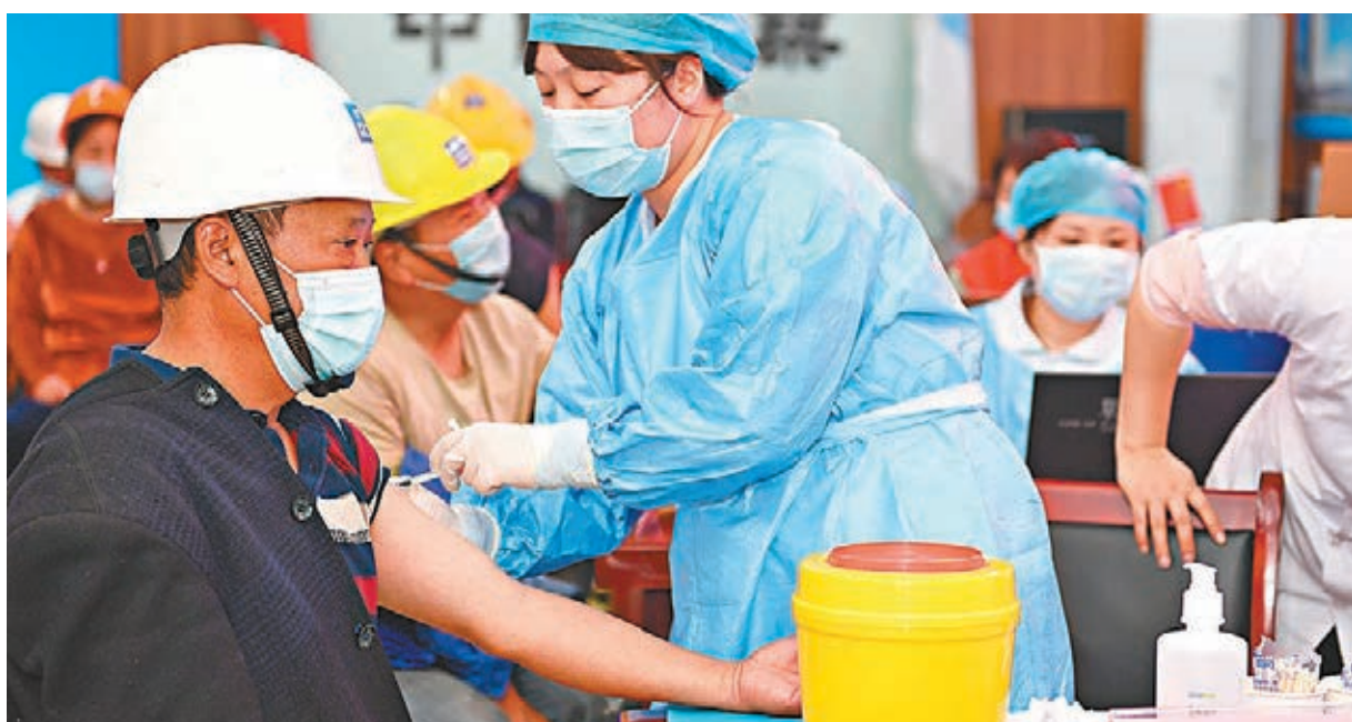
●5月19日，合肥市雙崗街道社區衛生服務中心工作人員為工地建設者接種新冠疫苗。

專家表示，內地接種現階段建議用同一個疫苗產品完成接種，無法用同一個疫苗產品完成接種時，可採用其他企業生產的相同種類疫苗產品完成接種。如果無法提供相同種類疫苗導致不能完成接種，要在具備條件的時候盡早完成相應劑次的補種。雖然疫苗種類、品牌眾多，但公眾無須過多比較挑選。因為已批准使用的新冠疫苗，在安全性與有效性等方面均有數據支撐，民眾按當地免疫規劃盡快接種即可。