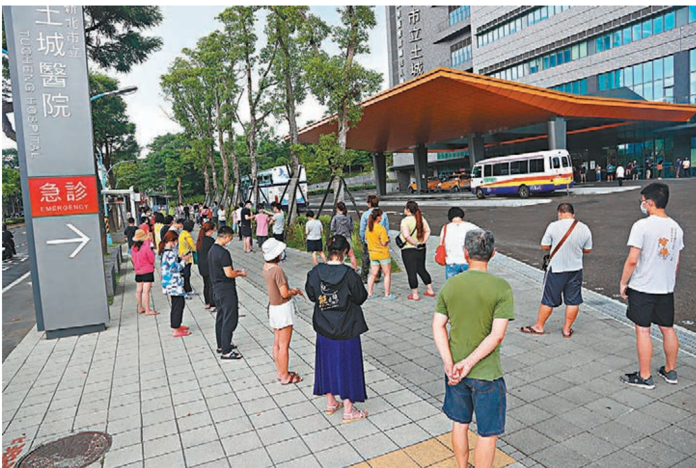
●台灣昨日新增267宗本土病例,這是台灣連續第5天單日確診病例破百。圖為新北市昨日增設土城醫院、永和耕莘醫院、樂生療養院3處篩檢站,下午土城醫院篩檢站外排滿等待篩檢的人流。