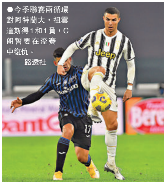
●今季聯賽兩循環對阿特蘭大，祖雲達斯得1和1負，C朗誓要在盃賽中復仇。

近日不停傳出今夏將離開祖記的C朗，日前突然把自己的愛車運離意大利，令他離隊傳聞更甚囂塵上；然而據意大利媒體《Gazzetta.it》報道，C朗其實每年暑假皆會把自己的愛車運走並運到不同地方，目的是到該地度假時可使用。另有意媒稱，C朗只是把車子拿去德國檢查。說回比賽，阿特蘭大已穩入來季歐聯，球員可在無後顧之下爭冠；只是首席射手路爾斯梅利爾及意大利國家隊守將拉菲爾杜萊之前一直受傷患困擾，雖然賽前消息指兩人可以復出，但狀態肯定非在最頂峰，加上阿特蘭大始終欠缺大賽經驗，發揮存在隱憂。