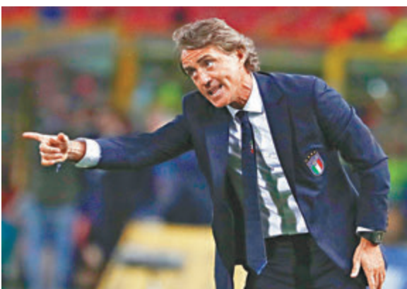
●文仙尼帶領意大利國家隊從缺席世盃的失利中重新振作。

同一時間，意大利亦公布了下月歐國盃決賽周的33人初選名單；值得注意的是今次沒有入選的球員並非一定不能出戰歐國盃，因為要應付歐聯決賽的車路士中場佐真奴費路，仍要為球會歐聯席位奮戰的AC米蘭新星辛度東拿利、阿利斯奧羅馬洛尼和卡拿比亞皆未有入選，因此入選的33人在本月24日展開的訓練營反而要以表現說服文仙尼自己值得入選。