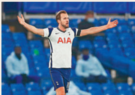
▲熱刺今年錯失了聯賽盃的捧盃機會，勢令卡尼更加下定離隊的決心。

另一方面，阿仙奴領隊阿迪達於昨日證實今夏完約的34歲巴西中堅大衛雷斯將於季後離隊，2019年加盟「兵工廠」的雷斯據報有望返回賓菲加效力。此外，水晶宮亦於昨晚宣布現年73歲的領隊鶴臣將於季尾離任，早前有消息指季中被車路士辭退的林柏特將會接任。