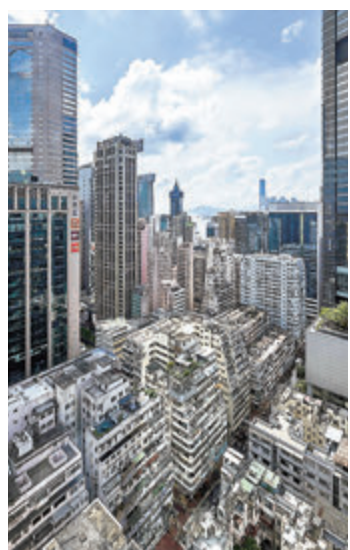
●大摩料經濟復甦加快支持樓價上升，將全年經濟增長上調至6.5%。

香港文匯報訊(記者 莊程敏)本港樓價節節上升，摩根士丹利昨日發表研究報告指，料經濟復甦加快支持樓價上升，維持今年樓價升3%的預測，明年升幅將增至5%。該行又指，由於香港經濟首季增長7.9%表現好過預期，因此將全年經濟增長預測由5%上調至6.5%，並維持明年增長可回復至疫情前的3%水平。大摩強調，地產股中較偏好住宅/零售多於寫字樓。