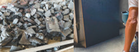
●CLS將原往堆填區的木板製成生物炭，並從中收集碳轉化為石膏添加劑。