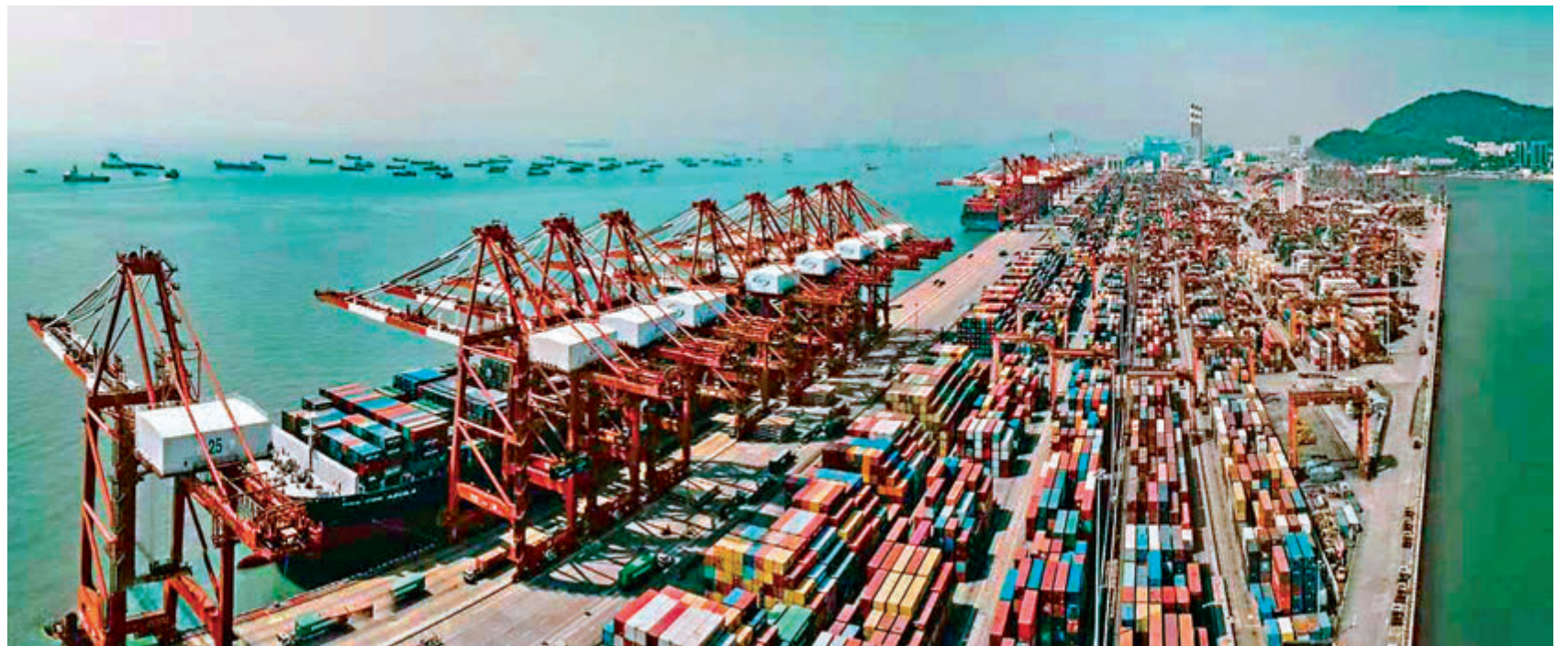
內地出口運價飆至歷史新高，意味着出口持續增長。圖為招商港口深圳西部港區。