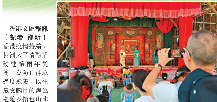
長洲太平清醮以神功戲代替。

香港文匯報訊(記者 邵昕)香港疫情持續，長洲太平清醮活動連續兩年從簡。為防止群眾過度聚集，以往最受矚目的飄色巡遊及搶包山比賽今年繼續暫停，原有的三座大包山高度降低至4.6米，但傳統項目神功戲表演則得以保留，惟觀眾需入場前量度體溫及掃描「安心出行」二維碼，彼此間亦需保持足夠社交距離。香港文匯報記者昨日現場直擊發現，因一眾活動取消，加上今年並無連續假期，長洲人流較往年大幅減少，當地食肆、度假屋、平安包售賣及各類雜貨小店亦因此銷情大跌。