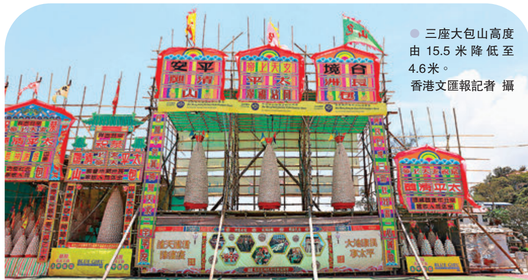
三座大包山高度由15.5米降低至4.6米。