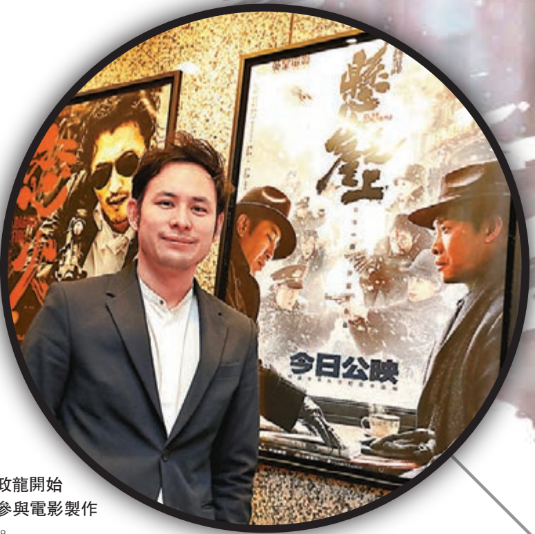
●楊政龍開始投入參與電影製作工作。