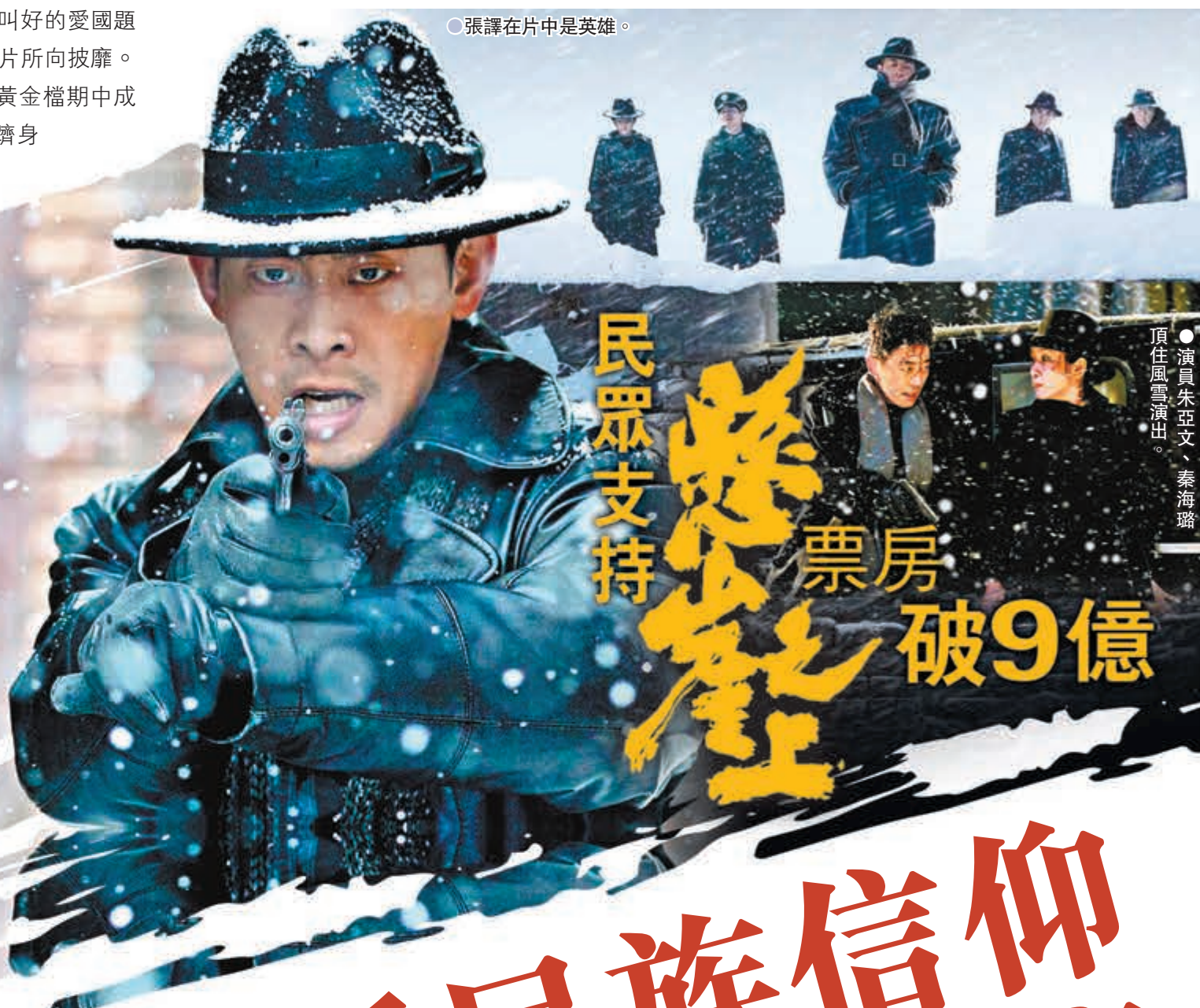
●演員朱亞文、秦海璐頂住風雪演出。