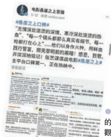
●片中角色的犧牲引發觀眾家國情懷。

電影《懸崖之上》上映半個月，在內地影評網站貓眼和淘票票均獲9分以上佳績，張藝謀導演可以說是憑實力征服了大部分入場觀眾。這部充滿懸念的抗日戰爭題材諜戰片，是張藝謀的首部諜戰片，更是他永攀新高峰的見證。影片劇情曲折、峰迴路轉，敵友難分，一場心理與智慧的交戰，讓觀眾感受到由內而生的刺激與恐懼。影片在「五一檔」中脫穎而出，並引發觀後熱議。部分觀眾欣賞張藝謀一貫穩紮穩打的風格實力，部分驚喜於影片黑色、白色、紅色為主濃烈、鮮明的色調，部分則為幾位主演老戲骨爐火純青的演技而歎為觀止。而影片中最令人動容的部分，則是先烈們「最後一顆子彈留給自己」的堅持，為信仰而犧牲的無畏精神令不少觀眾熱淚盈眶，激發了他們的家國之情。