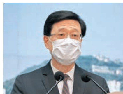
●保安局局長李家超。

果日報」,李家超指,今次所採取的行動,是依據法律去打擊一些危害國家安全的罪行,與新聞工作沒有直接的關係。任何人從事任何工作都必須守法,當有違法的行為,特別是涉及危害國家安全的罪行,當局必然會嚴厲依法處理。