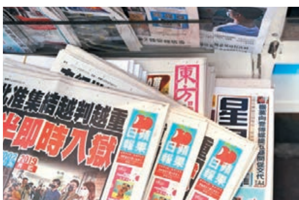
●蘋果日報母公司壹傳媒昨日起停牌。

果日報」,李家超指,今次所採取的行動,是依據法律去打擊一些危害國家安全的罪行,與新聞工作沒有直接的關係。任何人從事任何工作都必須守法,當有違法的行為,特別是涉及危害國家安全的罪行,當局必然會嚴厲依法處理。