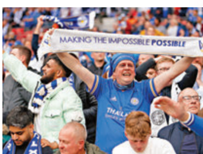
●2萬名球迷再次獲批准入場觀看決賽。新華社

李斯特城班主維猜過去一直和球隊上下打成一片，有着深厚的感情，可惜這位泰國班主在2018年因直升機事故離世，不過維猜家族之後仍然全力支持球隊一步一步提升。據英國傳媒早前報道，維猜生前曾和球隊分享贏得英足盃這項傳統盃賽的夢想，現在終於圓夢，難怪隊長卡斯柏舒米高賽後也甚為感觸：「我們的衣服裏有一張維猜的照片，代表他和我們在一起戰鬥，贏得英足盃是我們一直夢寐以求的事情。」