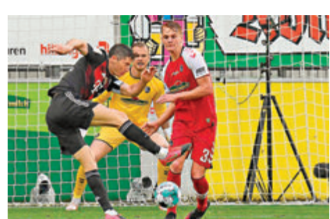
●利雲度夫斯基(左)追平梅拿紀錄。

夫斯基的表現感到高興，兩人都是史詩級的前鋒。」現年75歲的「轟炸機」梅拿職業生涯成就卓越，更助統一前的西德贏得1974年世界盃冠軍，可惜在2015年證實患上老人癡呆症。