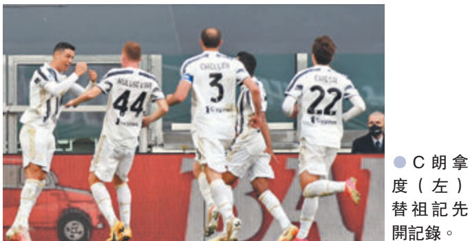
●C朗拿度(左)替祖記先開紀錄。

香港文匯報訊(記者 楊浩然) 意大利甲組聯賽於當地時間周六上演兩場爭四關鍵戰，結果「二哥」阿特蘭大作客以4:3險勝熱拿亞，肯定取得來季歐聯資格，至於祖雲達斯則3:2險勝國際米蘭，保持爭逐前四的希望。 阿特蘭大在全取3分後，目前以37戰得78分穩站第2位，領先周一凌晨登場的AC米蘭和已踢了37場比賽的祖雲達斯同為3分，但由於阿特蘭大在今季對祖雲達斯的對賽成績佔優，故已肯定可以保住前四位置，出席來季歐聯比賽。 祖雲達斯方面，由於今季對賽成績亦不及截稿前同分的AC米蘭，拿波里在昨晚比賽又擊敗費倫天拿，故目前已再度跌落聯賽榜第5位，本週日最後一輪比賽必須贏波而祈求AC米蘭和拿波里失分，才有機會取得來季歐聯資格。 「祖記」教頭派路賽後則表示，球隊現時面對的險境完全是自找的：「如果我們一早擁有今場贏波的表現和決心，目前肯定不用為前四席位而苦惱；事實上球隊今季實在犯了太多錯誤了，我們根本不應該失那麼多分；至於來季去留問題，我認為應該在完季後才再去想，現在要做的是專注部署最後一輪比賽。」