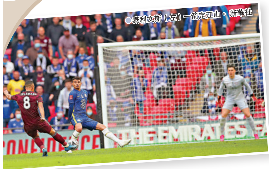
●泰利文斯(左)一箭定江山。