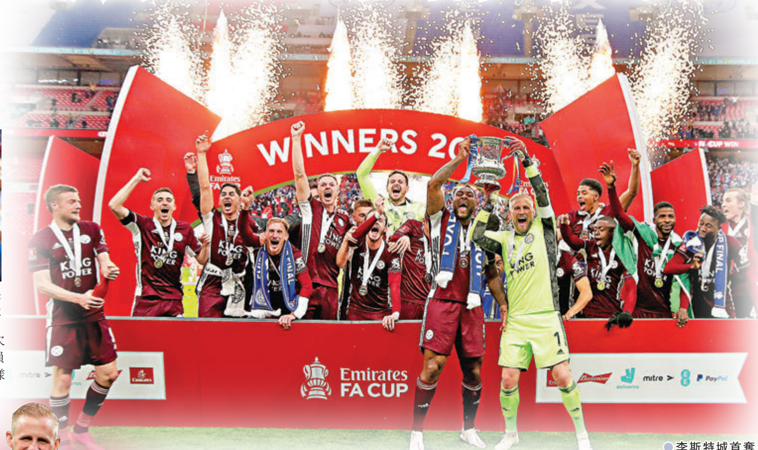
●李斯特城首奪英足盃。

望，並把一系列VAR爭議歸類為運氣欠佳：「當然我們很失望，但這不是球員的錯。今天我們只是運氣不好，在這樣水平的比賽中，你需要結合運氣、動力、細節、決策、球證判決等因素才能獲勝；至於對手那記手球，老實說我現在已不知道什麼時候是犯手球，什麼時候不是，我不知道什麼時候他們需要懲罰它，什麼時候又可以用手比賽。在整場比賽，我們防守做得非常好，反擊有侵略性，亦沒有讓對方有任何反擊機會，只是下半場對方入了一個精彩、帶點幸運，或者不應計算的入球，我們又有一個毫厘之間的越位入球被吹掉，所以球隊真的很不走運。」