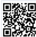
青創未來計劃報名

計劃現已在民建聯網頁接受報名(網址: www.eventdab.org.hk/ internship2021)，6月3日中午12時截止。