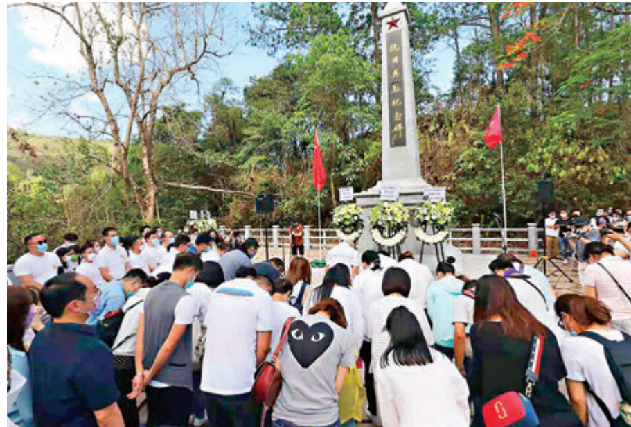
近百位團體代表來到烏蛟騰抗日英烈紀念碑，舉行紀念緬懷儀式。

為慶祝中國共產黨成立百周年，香港廣州社團總會、市屬團體昨日合辦「重溫抗日史蹟 緬懷革命先烈」活動，團體代表約百人來到烏蛟騰抗日英烈紀念碑獻花，鞠躬緬懷抗日英烈。廣州社團總會主席黃俊康表示，被日軍侵襲的時間是香港歷史上最黑暗的時期，希望大家牢記革命先烈的付出與艱辛，學習他們百折不撓的精神和堅定堅強的信念。