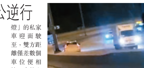
●有私家車在屯門公路逆線行駛，與迎頭車輛擦身而過，險象環生。

另一段同由車Cam拍下片段則顯示，一輛的士駛至近往深井支路前，發現前方一輛打着「死火