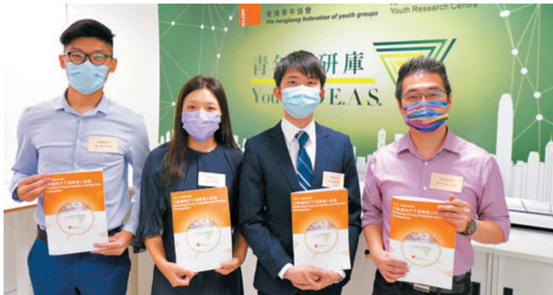
「青年創研庫」昨日公布「大數據時代下保障個人私隱」研究報告。