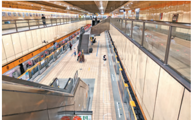
●5月16日的台北捷運站內空蕩蕩。