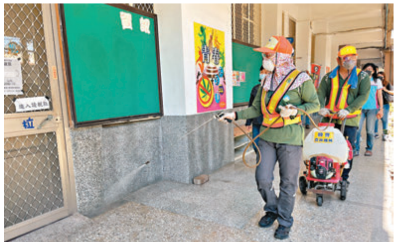
●高雄市環保局16日到高雄立營高中校園內進行消毒。