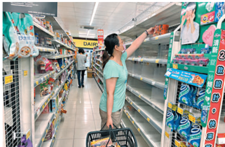
●高雄市民搶購日用品。

對此，其他網友紛紛表示：「口罩並沒有缺貨，但缺德的是商人」、「股票如果能這樣漲就好了」、「直接檢舉打擊奸商」、「消基會無法可罰嗎？這種坐地起價的可以檢舉吧」。