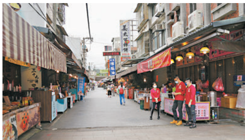
●往日人潮絡繹不絕的新竹縣北埔老街遊客減少，只剩下零星幾人。