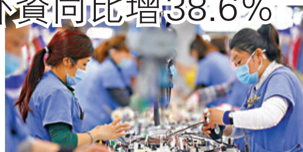
今年前4個月實際使用外資同比增38.6%。圖為早前遼寧省一外企工廠。

由商務部等多部門舉辦的第三屆「雙品網購節」於12日正式落幕，高峰介紹成效時表示，根據商務大數據對重點電商平台的監測數據，為期15天的活動帶動全國網絡零售額達到6,928億元，同比增長26.7%，其中，實物商品網絡零售額5,620億元，同比增長25.9%。