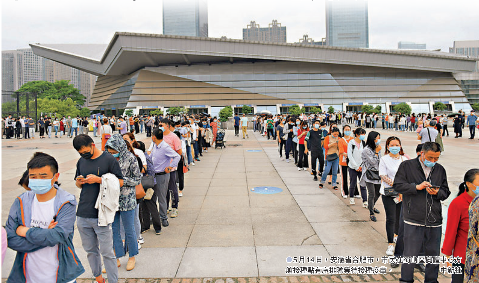
5月14日，安徽省合肥市，市民在蜀山區奧體中心方艙接種點有序排隊等待接種疫苗。

國家衛健委還表示，內地新冠疫苗接種工作保持穩妥有序、向上向好的態勢。截止到5月13日，內地累計接種新冠病毒疫苗36,691萬劑次，目前日接種能力超過2,000萬劑次。