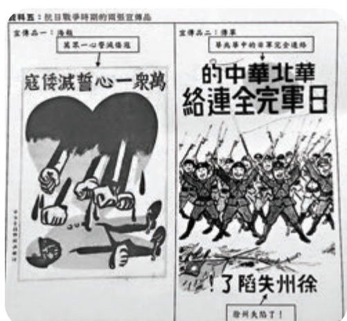
●去年文憑試中史科提供兩張中、日宣傳品，並問學生是否同意日方觀點。資料圖片