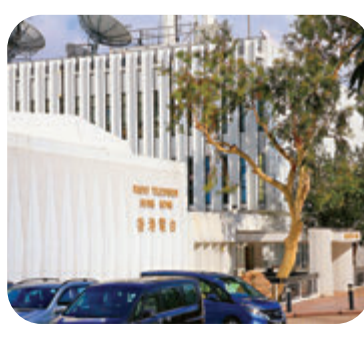
●香港電台昨日收到可疑粉末信，報警求助。

(處)鄧炳強署(處)長」的信件，發現信內有可疑粉末，爆炸品處理課人員接報到場檢驗，證實信內藏有一頁沾有濕水麵粉的紙，沒有危險成分，而紙上寫有文理不通中文字。