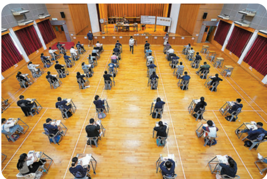
就改善文憑試擬卷機制及優化核心科考評，教育局提出多項措施，避免再有「黃考官」透過試題滲透偏頗不當的政治訊息與價值觀。圖為 DSE 考試。資料圖片