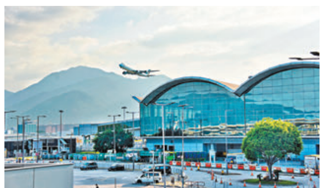
●香港收緊航班熔断機制，加強外防輸入。資料圖片

呼吸系統科專科醫生梁子超昨日在接受香港文匯報訪問時表示，香港熔断機制存在不可避免的滯後，強調若想盡早達至「清零」，需時刻關注不同地區的疫情資訊，及時刷新對地區風險的分類，並提前做好相應的防控安排。