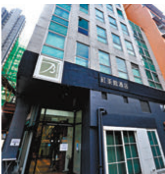
●檢疫酒店並非醫院，無妥善防控措施。圖為指定檢疫酒店之一的紅磡紅茶館酒店。

他說，採樣樣本並非採樣棒「隨便放入鼻內轉個圈」，若採樣員不具有護士資格，或會影響檢測結果，認為政府訂明採樣員需為具有感染控制經驗的護士，可有效解決早前檢測質素未如理想的問題。