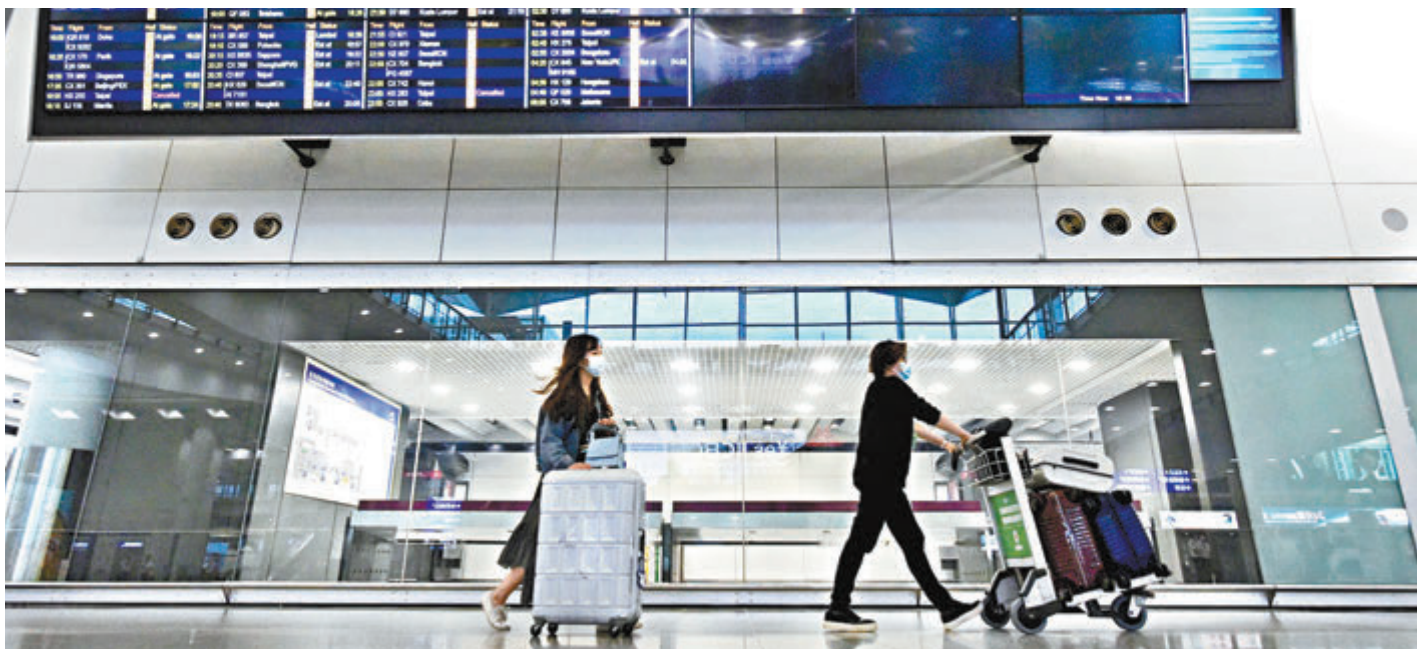
●台灣疫情升溫，入境香港須在指定酒店強檢兩周。資料圖片

台灣早前被列為低風險地區，入境人士只需要接受14日家居檢疫，並在抵港首日及第12日接受強制檢測。陳肇始昨日在立法會衛生事務委員會上表示，鑑於台灣地區本地確診個案有上升趨勢，所有曾逗留台灣的抵港人士，必須在指定酒店接受14天強制檢疫，不能家居檢疫，以減低病毒流入社區的可能。