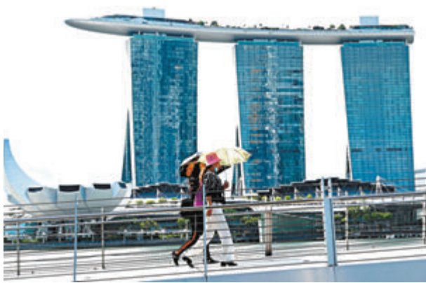
●星港旅遊氣泡很大可能延期。資料圖片

邱騰華強調，自上月宣布計劃重啟與新加坡的「航空旅遊氣泡」後，便一直留意兩地的疫情走勢，而新加坡於過去一周確實有比較多個案，並重申在疫情下能早日重啟「航空旅遊氣泡」或恢復往來是重要的，但亦要建基於安心及不會增加疫情的風險和威脅；如暫停啟動機制後，要至少多等14天再視乎情況才可決定何時重啟。