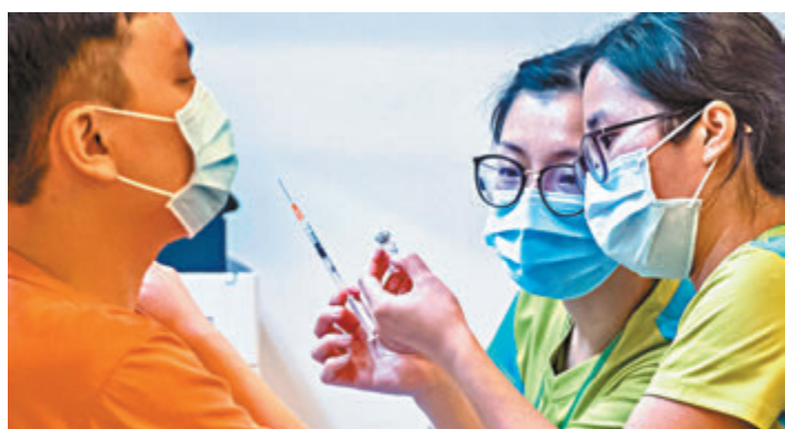
●專家委員會認為，無證據顯示接種疫苗會增加接種者死亡風險。圖為市民接種疫苗。資料圖片

報告指出，自疫苗接種計劃開始至本月2日，衛生署共接獲53宗懷疑貝爾面癱報告，其中46宗被判斷屬