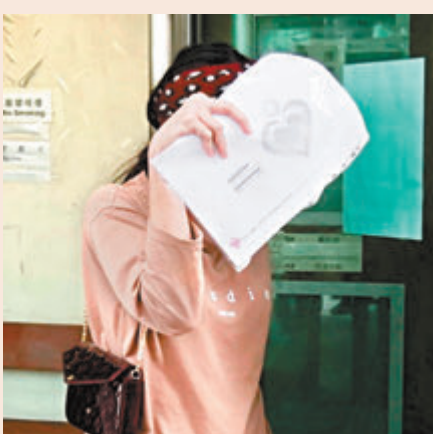
●菲裔女被告獲准保釋離開法院。

根據庭上資料，女被告為香港永久居民，在本港有正職，月入約2.6萬港元。男被告則今年3月19日由杜拜來港，在尖沙咀華美達麗酒店隔離檢疫至4月8日，完成檢疫後前往女被告位於佐敦伯嘉士大廈的單位居住。