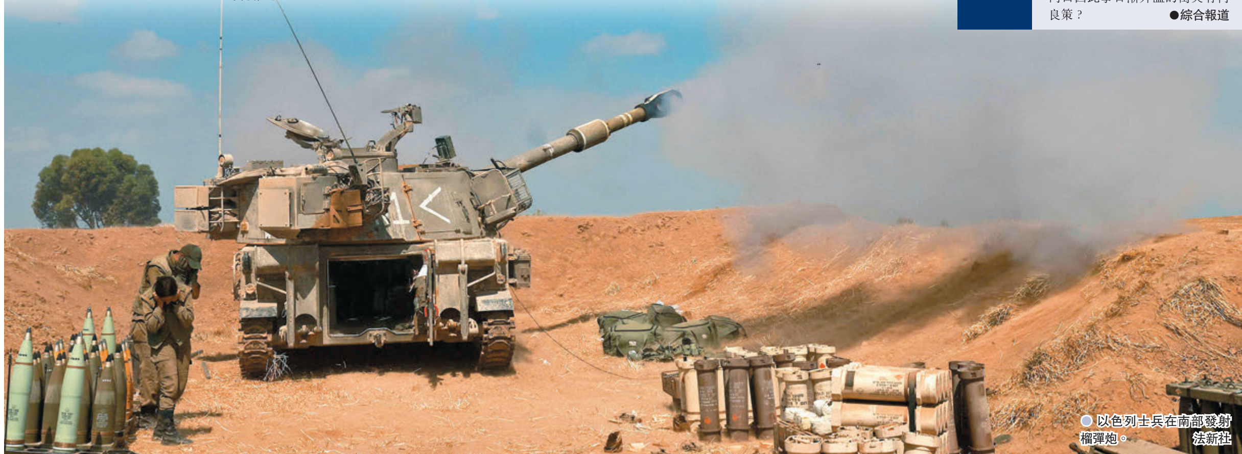
○以色列士兵在南部發射榴彈炮。

正當布林肯在網上替以色列說話時，當地時間周二晚，巴勒斯坦和以色列的支持者在以色列駐美國紐約領事館外爆發衝突，現場秩序一片大亂。不知道呼籲以巴衝突降溫的布林肯，對於自家門口因此事日漸升溫的衝突有何良策？ ●綜合報道