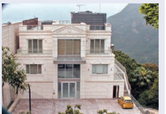
●山頂加列山道 73 號洋房，實用面積約 7,022 方呎。

她指出，現時亦有客查詢晉環頂層連天台及平台特色戶，最快下周加推此類單位，料有機會挑戰項目新高價。該盤累積 433 個單位，套現近 94 億元，平均成交呎價 32,931 元，項目共有 258 個單位選用意大利 Poliform 旗下 ALEA 廚櫃，包括部分三、四房及高層複式單位。