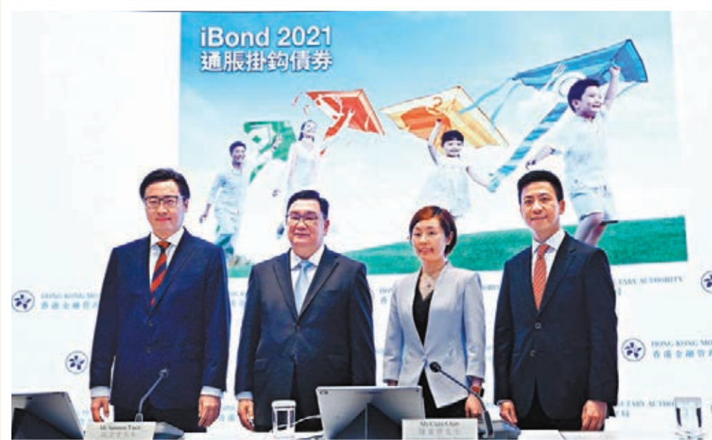
●金管局指，新批 iBond 保底息率定於 2 厘為合適水平，在構思時已考慮過不同因素。