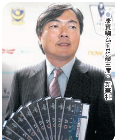
●康寶駒為前足總主席。

部審計機制，以監察及確保董事局和足總管理層改善足總的管治能力，並確保董事局適當地監督各秘書處部門和不同職級人員的工作表現。第3點是塑造「為足球服務」機構文化；最後則是加快推動「展望2025策略計劃」，以香港代表隊打入2034年世界盃為終極目標，進一步提升青訓規劃及聯賽水平。