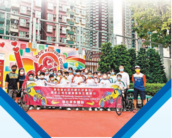
●學生體驗坊於早前展開。單車會圖片

「國家盃場地單車賽學生體驗坊」已在開賽前，於5月10日率先假中華基督教會基元中學舉行。活動吸引逾百名學生參與，完成第一部分介紹場地單車之講座後，第二部分的體驗班，讓他們試玩場地單車及進行分組聯校單車機比賽，為今次活動掀起高潮。每間參與活動的學校均可以報名角逐聯校賽事，比賽分個人及團體進行，設12至18歲共6個組別不等。整項活動完結後，將由香港單車總會認可成績，並發出獎牌及證書以示獎勵。