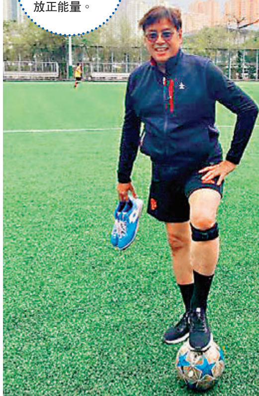
小方特別關心香港隊游泳和劍擊項目。