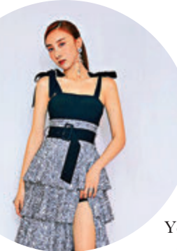
許靖韻以新手法演繹電影主題曲。