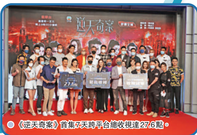
《逆天奇案》首集7天跨平台總收視達27.6點。

盈盈表示雖然已勝出第一回合，但參賽以來一直都感到有壓力，因緊張觀眾對她的評價，稍後她會進入決賽，預計決賽前仍然會心情緊張，希望能給大家驚喜，她又說：「2016年入行至今5年嚟，其實我一直咗好多苦功，又搵老師教演戲，等自己努力去練習，有錯嘅又會立刻糾正，呢啲唔係短3個月可以做到嘅事。」提到她之前因為準備參賽而令到經期失調，盈盈表示目前身體健康，並已學懂調節壓力。