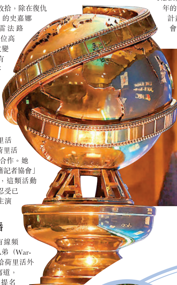
●金球獎一向被視為荷里活年度第二大頒獎典禮。

NBC續指：「因此，國家廣播公司將不會轉播2022年的金球獎頒獎典禮。在假設這個單位會執行相關計劃下，我們的立場會是於2023年1月轉播盛會。」