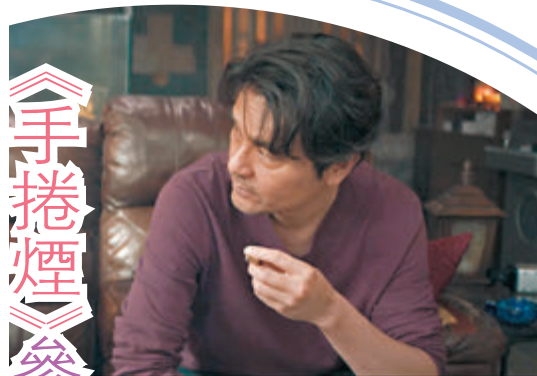
●《手捲煙》 將於烏甸尼舉行歐洲首映。

香港文匯報訊(記者 阿祖)影帝林家棟主演、新晉導演陳健朗首部執導作品《手捲煙》定於6月17日在港公映，近日再度傳出喜訊，電影獲邀參加第23屆意大利遠東電影節入選競賽部分，將代表香港電影角逐多個獎項，更將於烏甸尼舉行歐洲首映，讓意大利觀眾先睹為快。