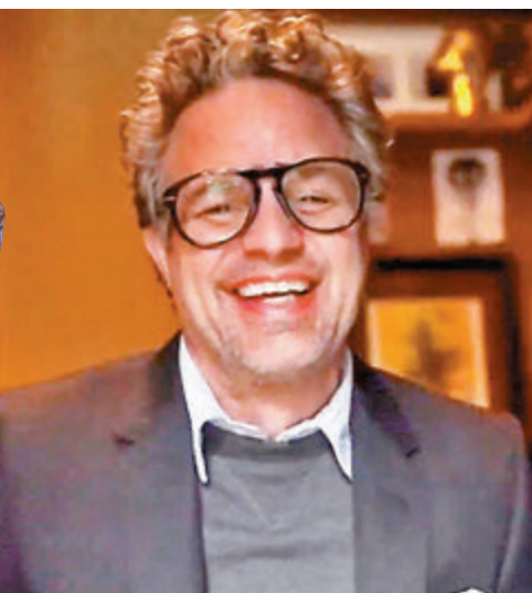
●「變形俠醫」麥克雷法路促金球獎要進行改革。