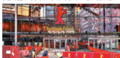
●柏林國際電影節即將在戶外舉行公映。

綜合中新社報道 歐洲三大電影節之一的柏林國際電影節最新宣布，鑒於德國柏林新冠疫情趨緩，已確定將於今年6月9日至20日以戶外方式舉行包括頒獎典禮和公眾展映在內的一系列活動。