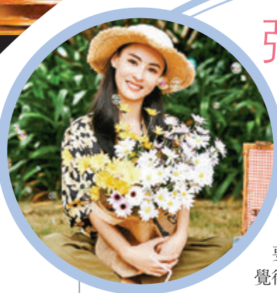
●張柏芝笑稱現時三個孩子太少了。