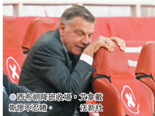
●西布朗降班收場，艾拿戴斯慘不忍睹。

三人進攻中場伊美路維、尼高拉斯比及韋利安各入一粒，協助阿仙奴於昨日凌晨的比賽主場輕取西布朗3:1。35輪過後積26分的西布朗已被倒數第四名的般尼甩開10分，提前成為本賽季3支降班隊的其中一員，來季隨錫菲聯落英冠作賽。大Sam本賽季中段接手當時位居尾二的西布朗當救火領隊，可惜球隊之後未見起色。這亦是曾帶領多支球隊護級的大Sam，執教英超17個球季中