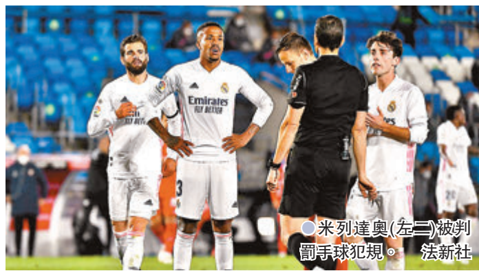
●米列達奧(左二)被判罰手球犯規。