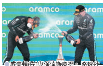
●咸美頓(左)與保達斯慶祝。

一級方程式(F1)西班牙站9日在巴塞隆納結束，平治車手咸美頓憑出色的戰術在末段反超前紅牛車隊的韋斯達賓，奪得本賽季的第三站冠軍，目前在