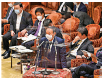
●菅義偉在國會接受質詢。

在9日，東京奧運測試賽在主辦場新國立競技場，以無觀眾的方式進行。比賽有420名選手參加，來自海外的運動員有9人，包括2004年奧運百米冠軍加