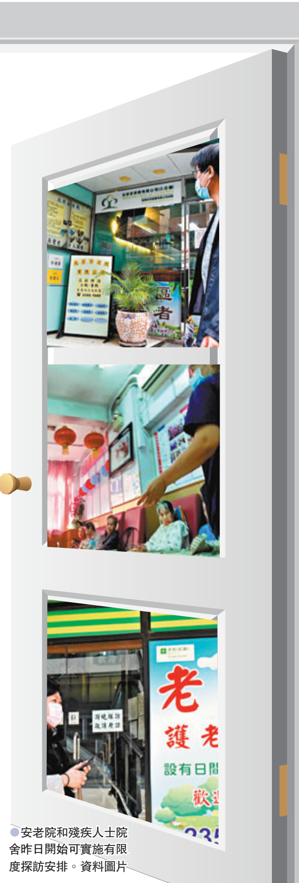
●安老院和殘疾人士院舍昨日開始可實施有限度探訪安排。

另有私營安老院舍負責人表示，在80多名院友中，現時只有一名家屬預約於星期五進行探訪，估計或因是需自費接受檢測，及需時消化新安排，故此態度較為審慎。他指出，院舍會繼續為院友家屬提供週切的安排，包括提供近照、安排視像通話等，期望特區政府將來可補貼檢測費用，或安排免費檢測。