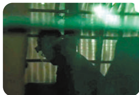
●涉嫌虛報和隱瞞確診前行蹤被檢控的印度裔男子，昨日由警車押往法院提堂。電視截圖