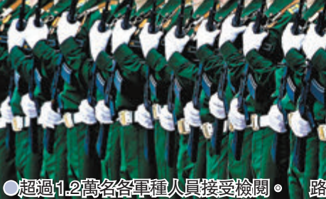
●超過1.2萬名各軍種人員接受檢閱。

除莫斯科外，聖彼得堡、加里寧格勒、海參崴等27個俄羅斯城市，昨日也舉行不同規模的閱兵。俄羅斯近期與歐美多國緊張關係升溫，先後互相驅逐外交官，此外，俄國與烏克蘭的邊境局勢緊張，俄國一度在西部接壤烏克蘭邊境集結軍力，並加強在黑海軍事部署。分析相信俄羅斯希望藉今次閱兵展示