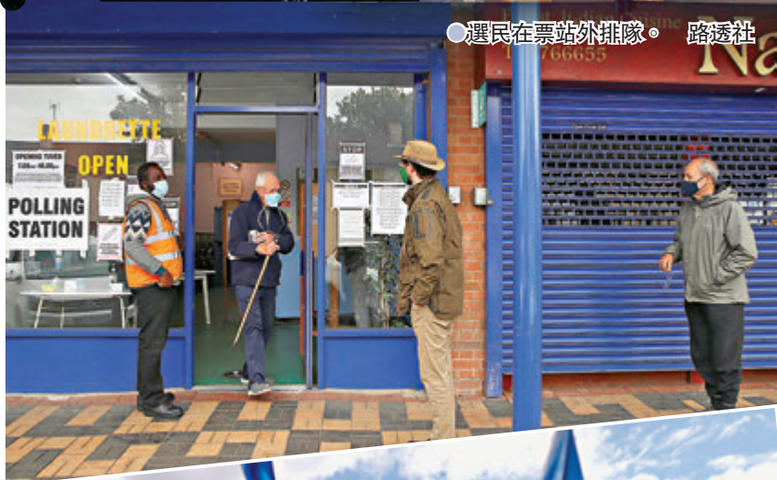
●選民在票站外排隊。