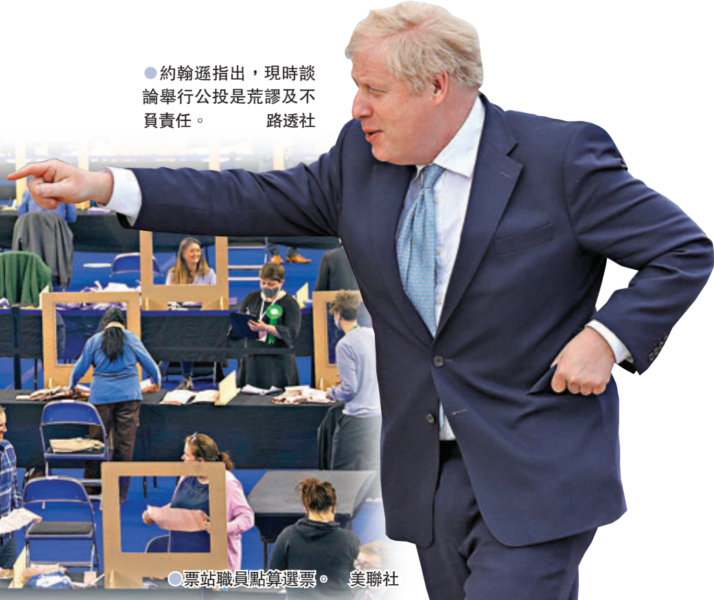
●約翰遜指出，現時談論舉行公投是荒謬及不負責任。