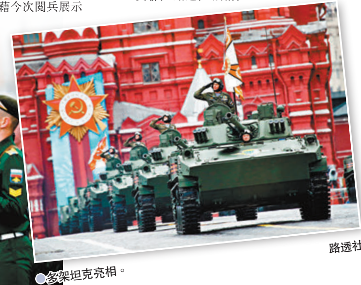
●多架坦克亮相。