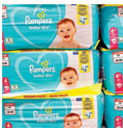
●美國尿片價格近期急升。

現時美國整體尿片價格較去年上升9%，受暴風雪影響，得州生產尿片所需吸水分成丙稀酸的廠房一度停運。雖然部分廠房已恢復生產，但當時受損的設備尚未完全修復，因此產量仍受限制。生產商Kimberly-Clark早在3月已預告，由於原材料價格上漲，將調高部分產品價格。居於賓夕法尼亞州的克利爾表示，9片裝尿片售價從8美元(約62港元)升至9美元(約70