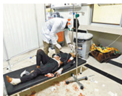
●許多傷者傷勢嚴重。

遇襲地區為伊斯蘭教什葉派聚居地，過往經常遭受遜尼派激進分子攻擊。總統加尼指爆炸案是塔利班所為，塔利班領袖阿洪扎達否認施襲，