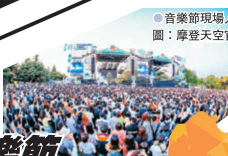
●音樂節現場人山人海。