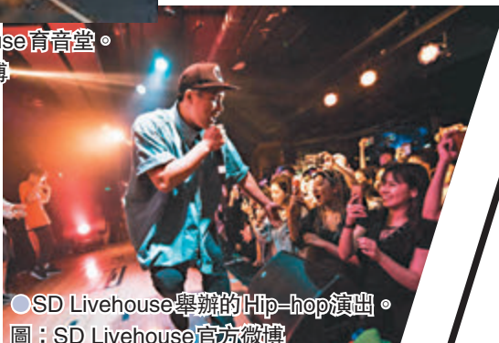
●SD Livehouse舉辦的Hip-hop演出。