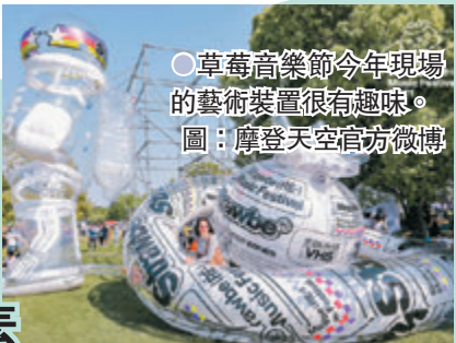
●草莓音樂節今年現場的藝術裝置很有趣。

今年全球疫情限制，基本無法邀請外國樂隊及歌手來到國內演出，因此各地音樂節的陣容也難免出現了趨同的尷尬，但這並不代表着觀感的同質化。許多品牌的音樂節，都創新性地在演出之餘加入了新的文旅元素，令音樂節的文化質感蛻變升級。 內地最大獨立唱片公司摩登天空旗下的草莓音樂節，自2009年創辦至今，已覆蓋33個城市，為廣大樂迷所熟