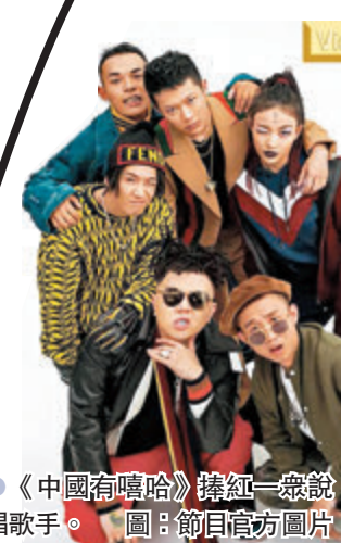
●《中國有嘻哈》捧紅一眾說唱歌手。 圖：節目官方圖片