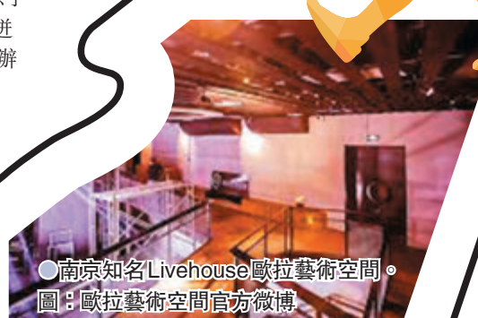
●南京知名Livehouse歐拉藝術空間。