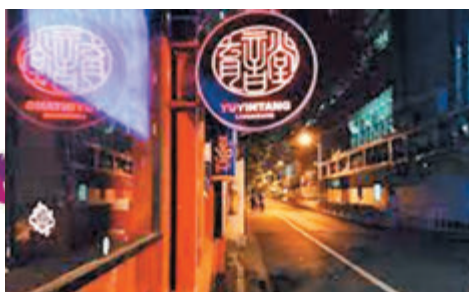
●上海知名Livehouse育音堂。

Livehouse起源於日本，是專門進行室內音樂演出的場館，儘管面積不及體育館等大型場館，但因為配備有專業的音樂器材、音響等設備，Livehouse的演出效果勝過駐唱酒吧更多。而比較小型的空間又使得觀眾與演出者距離拉近，因此有時演出氛圍會比在大型體育館演出更好。在歐美，因為演出效果好、成本低廉，不少大牌藝人都會頻繁在Livehouse進行演出。近幾年在中國，Livehouse也遍地開花，不少城市都至少有一個名聲在外的Livehouse，像北京、上海、廣州這樣的大城市則有不止一個。此外，更出現了「MAO」這樣做出自己品牌的Livehouse，從2007年創辦至今在不同城市拓展連鎖化經營，現已覆蓋了北京、上海、杭州、成都等9個城市。 Livehouse與大型場館常承接流行歌手的演出不同，它的演出主要集中在民謠、搖滾、說唱等受眾群體較少的音樂流派，因此在為城市營造良好的音樂氛圍之餘，Livehouse也為獨立音樂人的向上發展添磚加瓦，不少知名獨立音樂人及樂隊，都是承蒙當地Livehouse的孵化才逐漸成長壯大。比如廣州的191 Space、Tu凸空間、SD Livehouse、廟色唇等Livehouse，均是由一眾音樂人創立，他們秉持「扶持本土獨立樂隊」的目標，不計代價地支持本土獨立樂隊乃至初創樂隊，給予他們演出的機會，才令許多不為大眾所知的樂隊嶄露鋒芒。