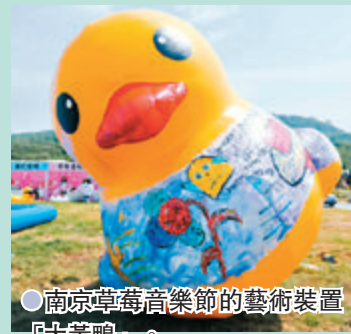
●南京草莓音樂節的藝術裝置「大黃鴨」。

知。草莓音樂節今年以「RE」（意指從頭再來）為主題，在活動現場加入主題社區，以潮流藝術、獨立文化、新消費場景等角度呈現出多元的音樂節現場體驗。比如在上海草莓音樂節的現場，摩登天空就將當地藝術家、設計師的藝術裝置、潮牌Pop-up Store、精品咖啡、特色餐飲等帶到音樂現場，令音樂節成為了具有城市當地特色、有溫度的青年文化盛會。