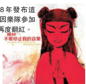
●痛仰樂隊2008年發布這張專輯，多年後因樂隊參加《樂隊的夏天》再度翻紅。

隨着播出多年的主流音樂競技節目《中國好聲音》、《歌手》光環褪去，取而代之的是類型更加多樣、覆蓋面更為廣泛的新型音樂綜藝節目：首播於2017年的《中國有嘻哈》（後更名為《中國新說唱》），收視率很快擊敗同期開播的《中國新歌聲》（原名《中國好聲音》），不僅將較為小眾的Hip-hop文化帶入大眾視野，更帶火GAI、PG One、Jony J等一眾說唱歌手並將他們推向市場；首播於2018年的《即刻電音》，令觀眾見識到中國電子音樂的創造力，也為默默耕耘的年輕電音創作者打開了上升通道；首播於2019年的《樂隊的夏天》，豆瓣評分由7.4直飆8.4，引得無數觀眾追看，並讓新褲子、痛仰、重塑雕像的權利、五條人、達達等樂隊再度爆紅，收穫大批年輕粉絲…… 這些音樂綜藝節目令觀眾了解到更多小眾音樂類別，給了原本被忘卻或被忽視的獨立音樂人一個嶄新的舞台。而綜藝的形式也為節目增加了可看性，比賽環節的創新以及舞台設計的驚艷，都令觀眾升級了視聽體驗，激起關於節目的熱議，也令觀眾更關注音樂創作人本身。另一檔首播於2019年的音樂綜藝《我是唱作人》，就將流量明星、搖滾老炮、民謠、說唱歌手等不同風格的唱作人匯集於同一舞台之上，全方位滿足觀眾不同口味的同時，也令不同類別打破壁壘，碰撞出神奇的火花。