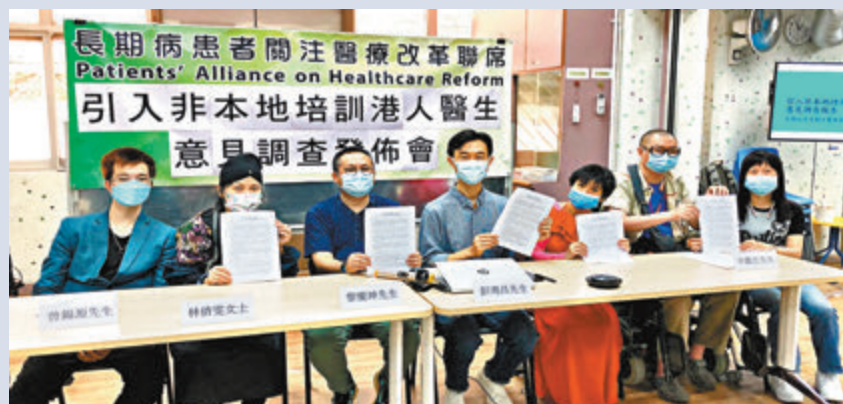
●63.2%受訪者都相信非本地醫生亦具備專業資格。

不過，聯席的調查顯示對非本地培訓醫生欠信心的市民只屬少數，63.2%受訪者都相信非本地醫生亦具備專業資格，只得28.9%人表明沒有