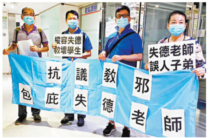
●教協近日就教師離職和退休大做文章。圖為市民早前抗議教協包庇失德黃師。

另外，教聯會副主席鄧飛昨日亦表示，本港教育界自香港國安法推出以來日漸回復平靜，若非在校園內灌輸政治思想，是不會感受到有壓力。他質疑教協相關調查數據，形容更像是教協蓄意製造業界恐慌。不過，他認為，本港有4間大學可進行師資培訓，近年又有不少「港漂」教師湧現，絕不會出現