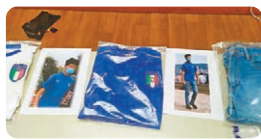
警方在非禮案疑犯家中檢獲犯案時穿着衣物，包括意大利足球隊的球衣。

及分析後鎖定涉案疑犯，於前晚7時在黃大仙拘捕涉案的本地男子，並發現他於3月27日、4月12日及5月3日在尖沙咀梳士巴利道涉及非禮另外3名女子，受害人年齡由20歲至50歲不等。張美欣指出，該男子每次均假扮遊客接近女性，要求與女子合照，借機接觸對方的敏感部位。據悉，包括攬腰、摸胸等。警方呼籲相關案件的其他受害人如未報案，應盡快與警方聯絡，如有相關資料提供，可致電36619347與調查人員聯絡。