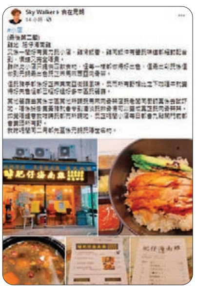
網民批評「Sky Walker」推薦嘅黃店非常難食，質疑佢係收咗錢噏宣傳做打手。