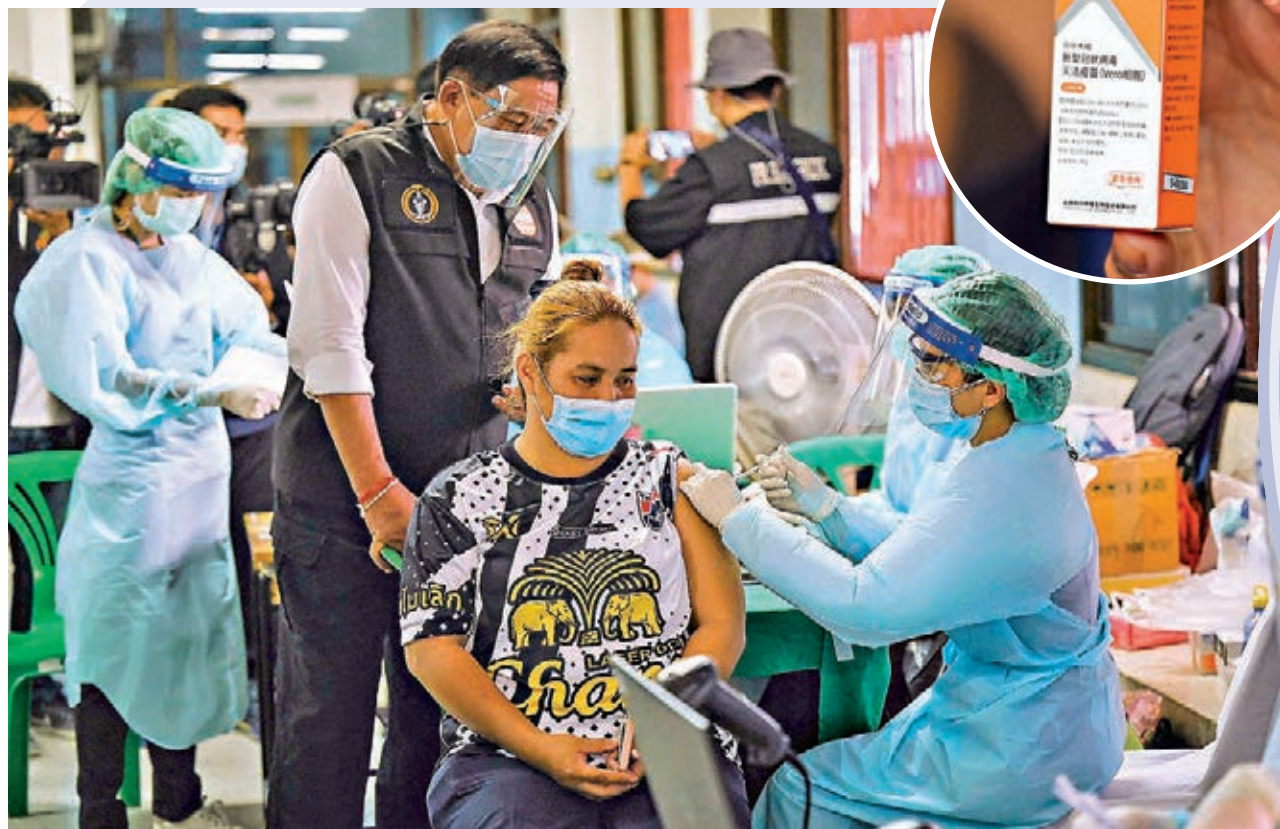
▲泰國曼谷民眾日前接種中國科興疫苗,市長阿薩瓦(後中)到現場視察。