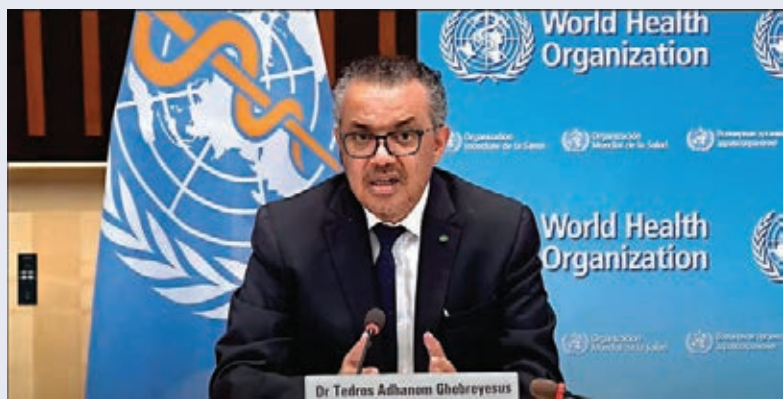
●中國國藥新冠疫苗獲世衛組織緊急使用認證。圖為世衛總幹事譚德塞5月7日在瑞士日內瓦出席發布會。

譚德塞表示,國藥疫苗滿足世衛組織有關新冠疫苗安全性、有效性及其質量的標準。世衛組織主導的「新冠肺炎疫苗實施計劃」(COVAX)可以採購國藥新冠疫苗,增強相關國家藥品監管機構批准這款疫苗的信心,加快國藥集團疫苗進口和接種速度。世衛組織建議,18歲以上成年人可接種兩劑國藥疫苗,間隔時間為三至四周;世衛組織還建議不設定接種年齡上限——因為初步數據顯示該疫苗對老年人也有保護作用。