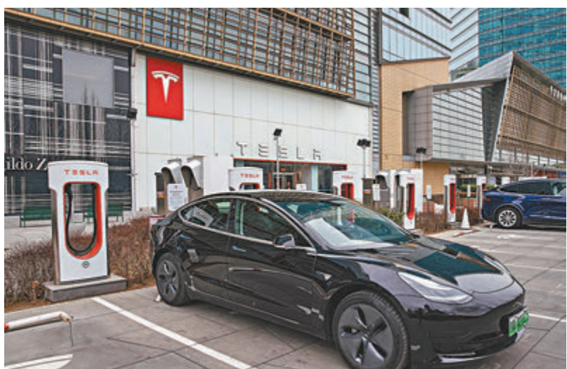
● 美股第1季財報至今表現亮眼，包括特斯拉等盈利都優於市場預期。圖為特斯拉北京華貿中心體驗店。資料圖片