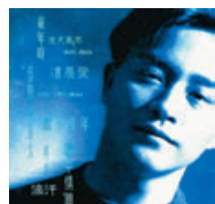
張國榮唱的《似水流年》版本，令筆者另眼相看。作者供圖

以上種種養分為我磨練了聽歌修養（不單止樂器或唱歌，聽歌除了天性使然，也需適當訓練），誰知日後用到自己設計的時裝發布會，也用到電台廣播；在這兩個範疇上，從來不肯假手於人，定必由自己選曲，配合衣服風景與廣播主題。（持續）